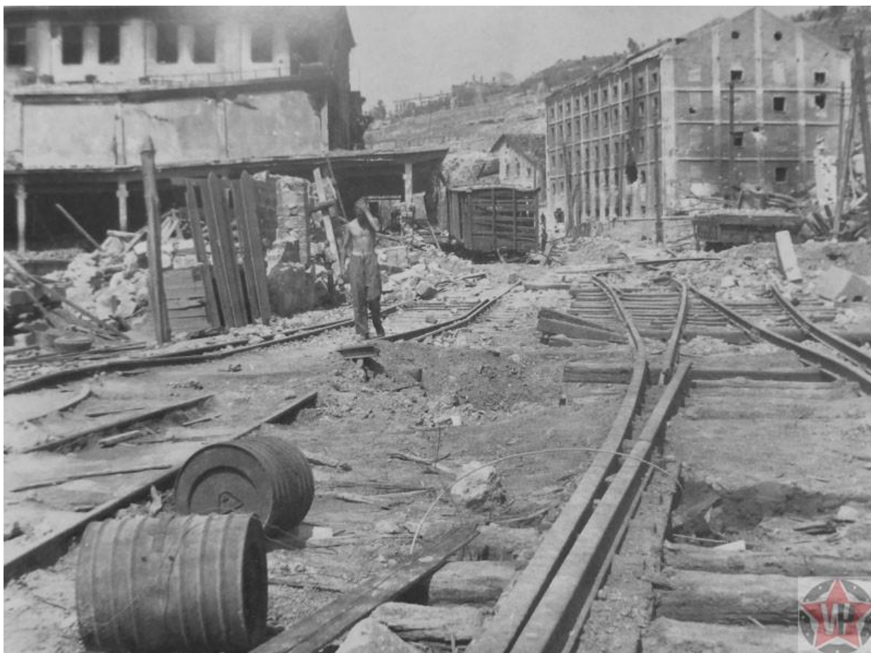
Разрушенное депо в Севастополе

За месяц до взятия Севастополя немцы сформировали оккупационные органы управления. Была создана военная комендатура, управление службы безопасности и городская управа, во главе с бургомистром. Также была созвана полиция из местных жителей, проявлявшим лояльность к оккупантам. Местная комендатура полностью подчинялась немецким властям. Ее основной задачей было снабжение немецких властей продовольствием.