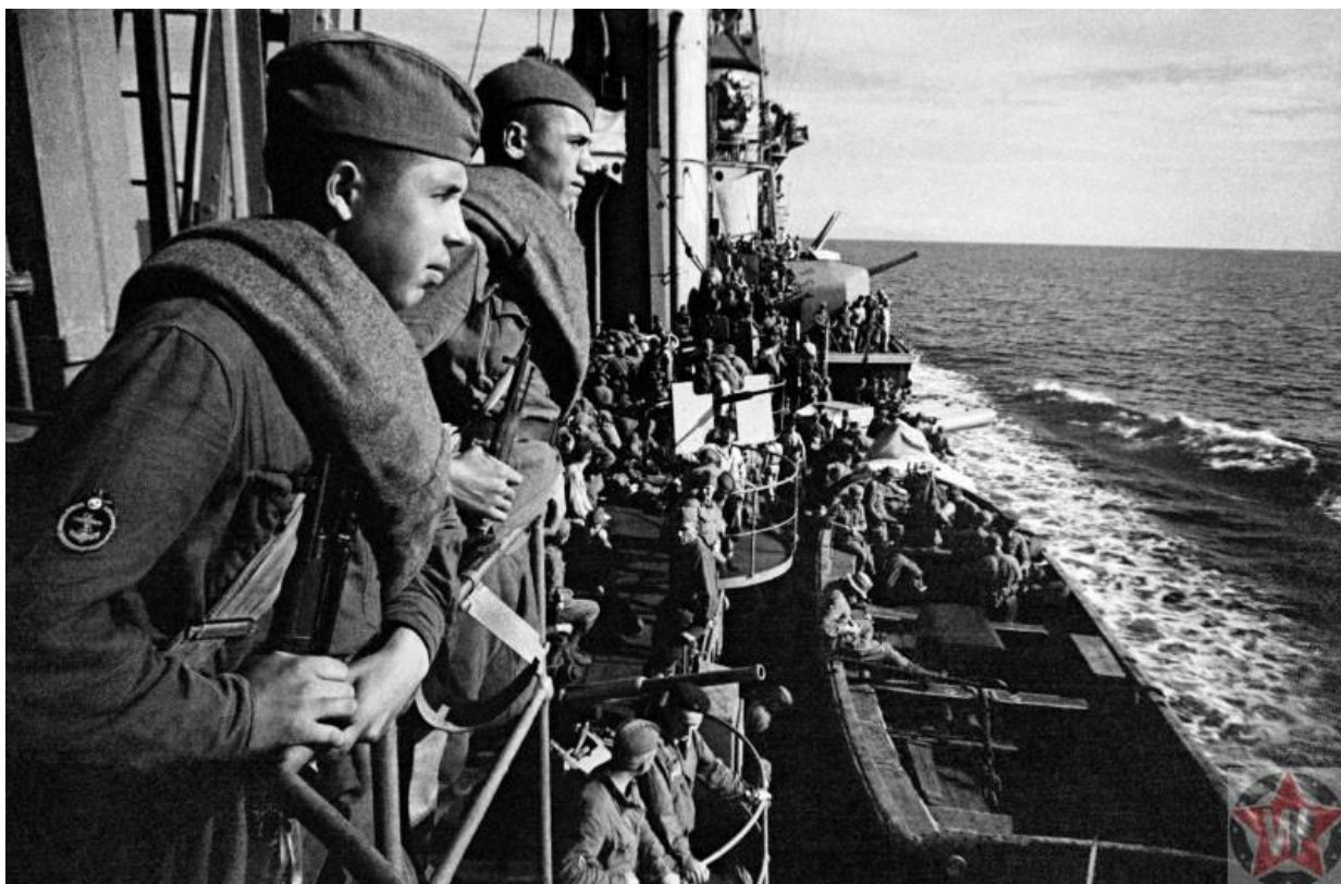
Крейсере «Красный Кавказ» на подходе к Севастополю

С 27 мая Севастополь почти ежедневно подвергался артиллерийским обстрелам и бомбардировкам с воздуха. 7 июня после продолжительной артиллерийской подготовки немецкая армия перешла в наступление. Главный удар пришелся на восточный берег Севастопольской бухты, вспомогательный — на юго-восточную окраину города. В течение 5 дней велись упорные бои, в результате которых советским войскам пришлось отступить. 18 июня противник вышел к Инкерману и Сапун-горе.