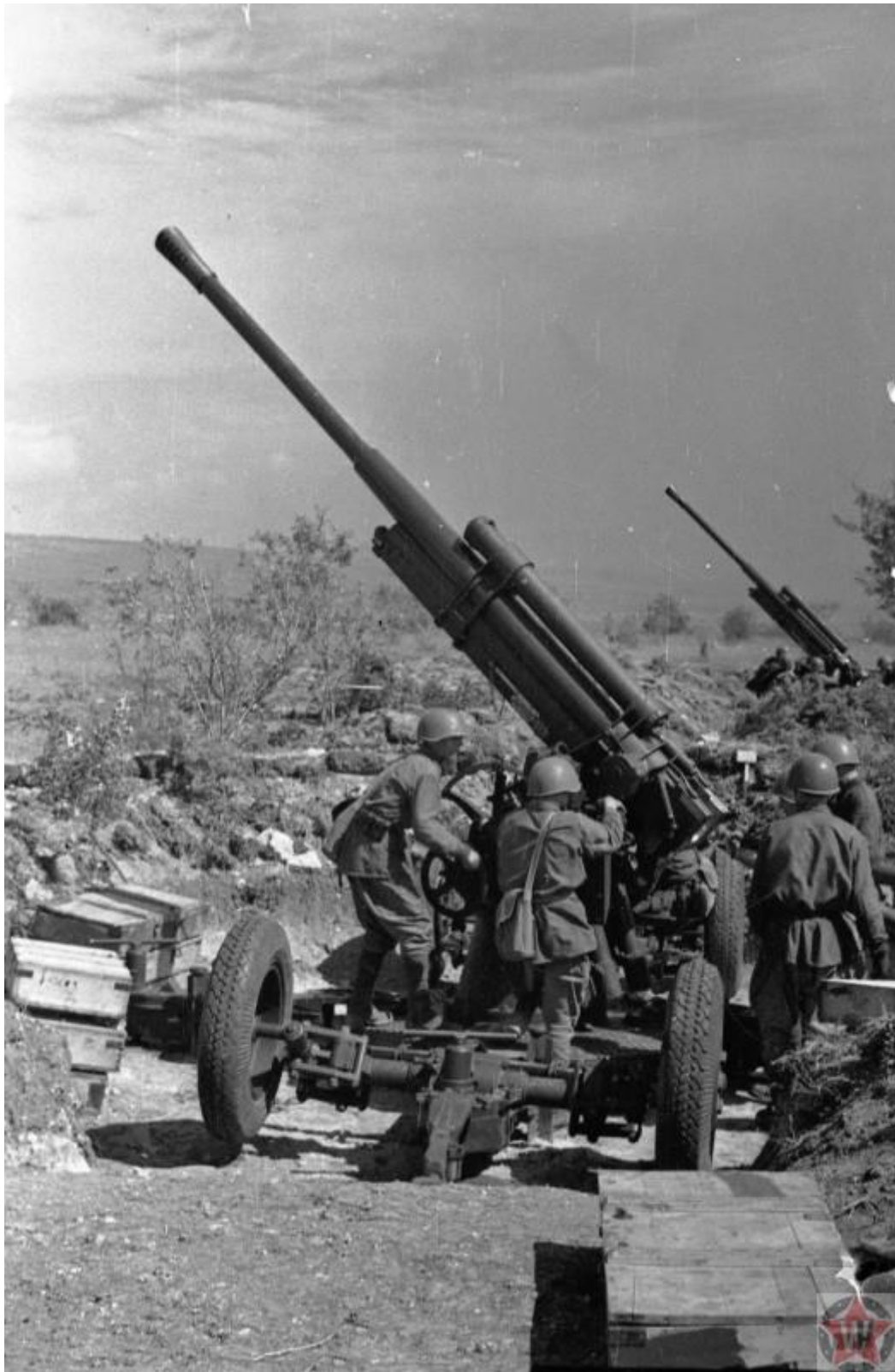
Зенитно-артиллерийский полк ПВО под Севастополем. Крым, СССР 1942 год

4 ноября войска флота и сухопутные подразделения, в том числе прибывшие из Одессы части Приморской армии, были объединены в Севастопольский оборонительный район. Его командиром назначен вице-адмирал Ф. С. Октябрьский, а его заместителем — генерал-майор И. Е. Петров. Защитники города располагали 170 артиллерийскими орудиями и 100 самолетами. Общее количество бойцов составляло порядка 50 тыс. человек. Множество жителей города вступило в народное ополчение. Отдельный батальон был