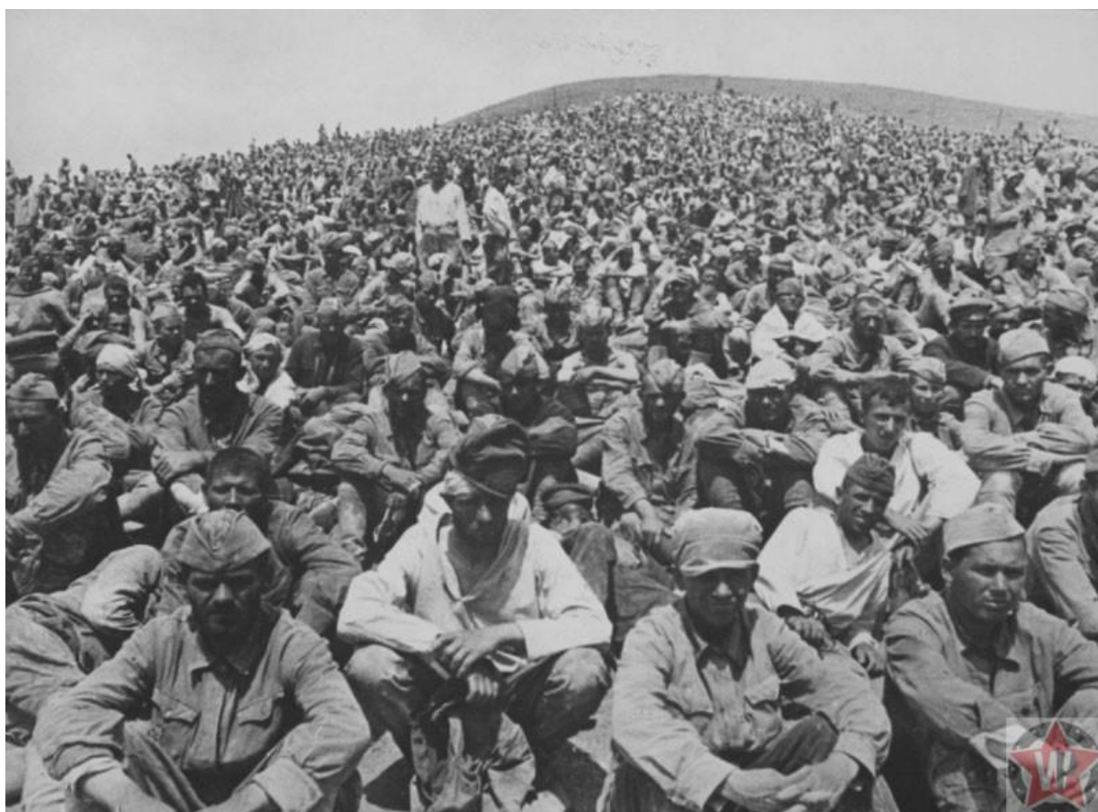
Пленные бойцы Красной Армии под Севастополем

Для жителей города вводился комендантский час. Всех, кого задерживали на улицах в зимнее время с 17 до 6 ч. и в летнее с 20 до 6 ч. подвергали проверке и отправляли на принудительные работы сроком до 10 дней.