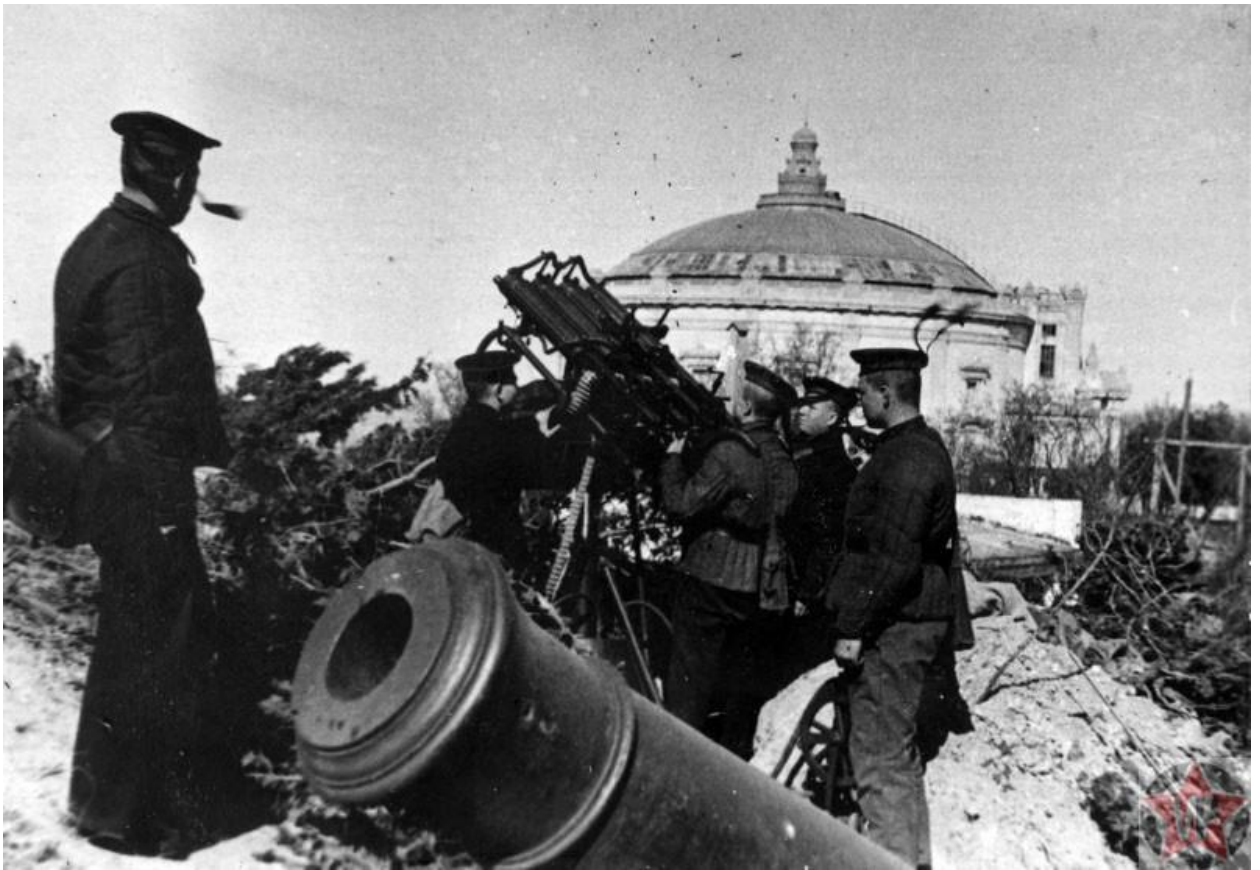
Зенитно-пулеметный расчет ведет огонь по самолету противника