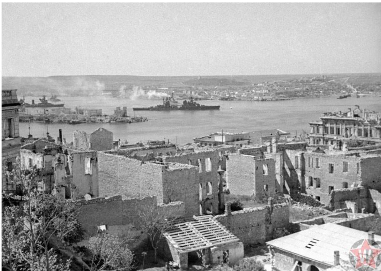
Крейсер «Ворошилов» и линкор «Парижская коммуна», Севастополь 1942 год

создалось опасное положение — неприятель вклинился в расположение советских войск. Чтобы избежать прорыва немцев к Севастопольской бухте, в Ставке было принято решение об усилении оборонявшихся двумя стрелковыми дивизиями и одной бригадой, доставленными по морю.