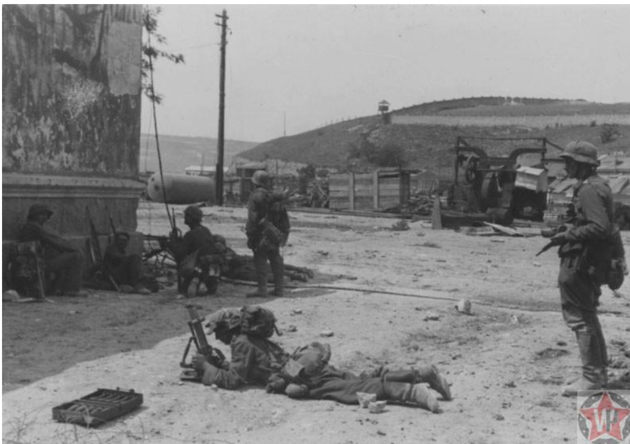
Немецкие солдаты на улицах Севастополя

К сожалению, советские войска не успели при отступлении уничтожить документацию городского отдела НКВД, паспортного стола и ЗАГСа, которая попала в руки немцев. С помощью этой документации немцы смогли провести учет всего трудоспособного населения и выявить лиц, считавшихся политически опасными. К концу августа 1942 года было казнено 1,5 тыс. человек, среди которых члены партии, комсомольцы, руководители предприятий, сотрудники милиции, лица, награжденные правительственными наградами и представители некоторых этнических групп. Расстреливали людей, обнаруженных в чужом доме без документов, и жителей этого дома.