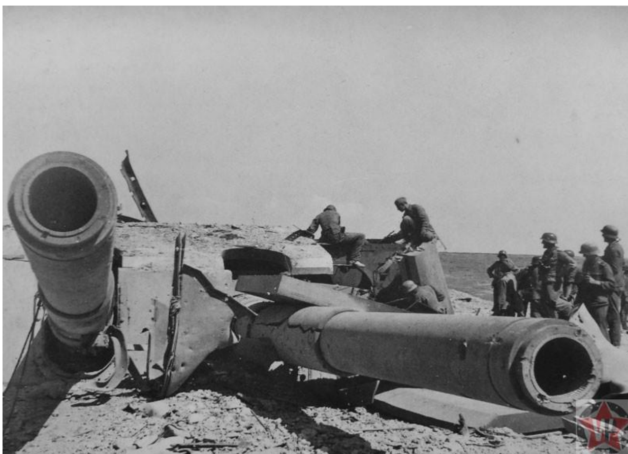
Солдаты Вермахта у разрушенной башни №2 батареи № 30 в Севастополе.

К началу войны город не был защищен укреплениями с суши. В июле началось строительство трех линий обороны, которое было окончено к 1 ноября 1941 года. Работами руководил инженерный отдел флота под командованием В. Г. Парамонова — военного инженера I ранга. Передовые укрепления имели протяженность около 35 км, а тыловые, находящиеся в 2-3 км от Севастополя — 19 км. В систему обороны входили артиллерийские батареи и минные поля. Третий, главный рубеж обороны, расположенный между Керчью и Балаклавой, к началу штурма города не был завершен до конца. Защита бухты Севастополя обеспечивалась береговой артиллерией и кораблями Черноморского флота.