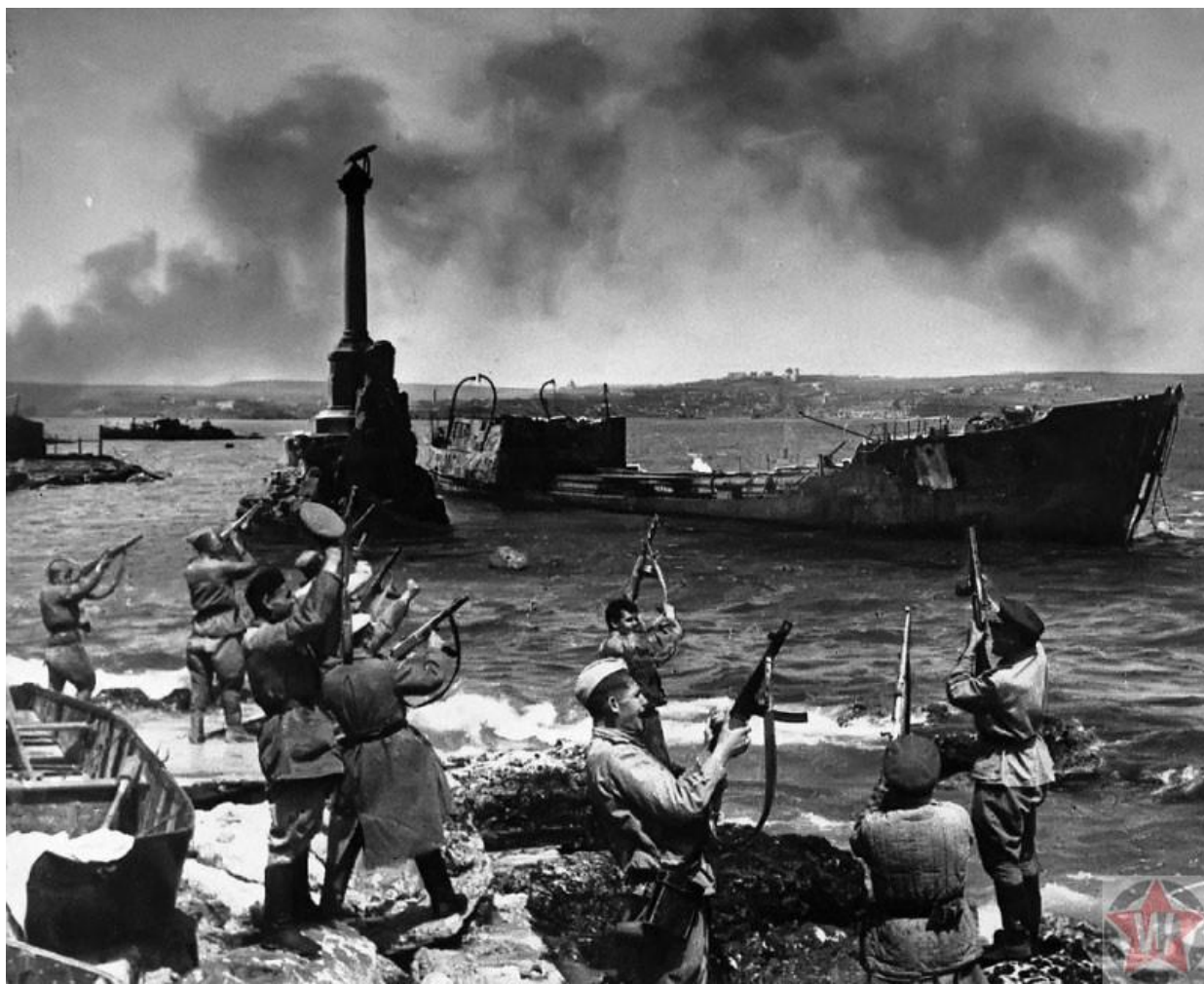
Освобождение Севастополя, 1944 год

несмотря на численное преимущество. Более 300 тыс. немецких солдат и офицеров были убиты или получили тяжелые ранения. Оборона Севастополя продолжалась намного дольше, чем планировали в штабе немецкой армии. Столь необходимые фронту самолеты и артиллерия были задействованы на штурме города. Противник был лишен возможности использовать 11-ю армию в операции под Харьковом, вследствие чего скорость наступления немецко-фашистских войск замедлилась. Неприятель смог усилить активность на южном направлении только после падения Севастополя.