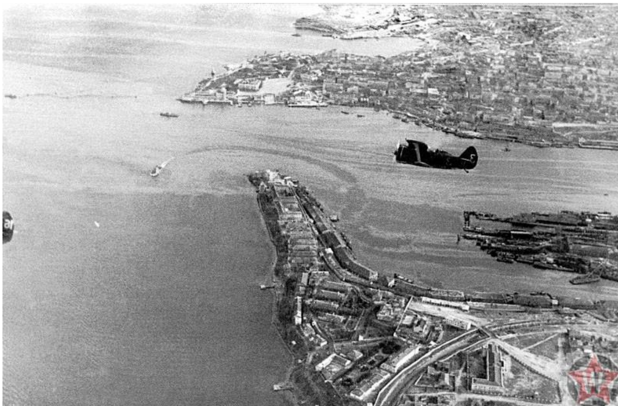
Панорама города Севастополь, фото 1941 год

В планах немецко-фашистского командования Крыму отводилось большое значение. Овладев полуостровом, гитлеровская Германия получала доступ к Кавказу, где находились советские запасы нефти. Крым также планировалось использовать в качестве базы снабжения южной группы армий. Операция по захвату полуострова являлась частью плана «Барбаросса», который предусматривал стремительное наступление на СССР и завершение войны осенью 1941 года. В штабе противника не могли предвидеть, что вторая оборона Севастополя будет не менее упорной, чем первая.