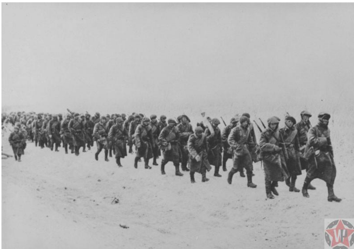
Колонна румынской горнострелковой бригады в направлении Севастополя, 1941 год

Наступление на Ишуньские позиции началось 18 октября. Советские войска оказывали упорное сопротивление немецкой армии, несмотря на значительное превосходство противника в живой силе, технике и авиации. В результате 5-дневных изнурительных боев советские войска были вынуждены отойти вглубь полуострова. 26 октября войско Манштейна получила свежие подкрепления и смогла развить успех.