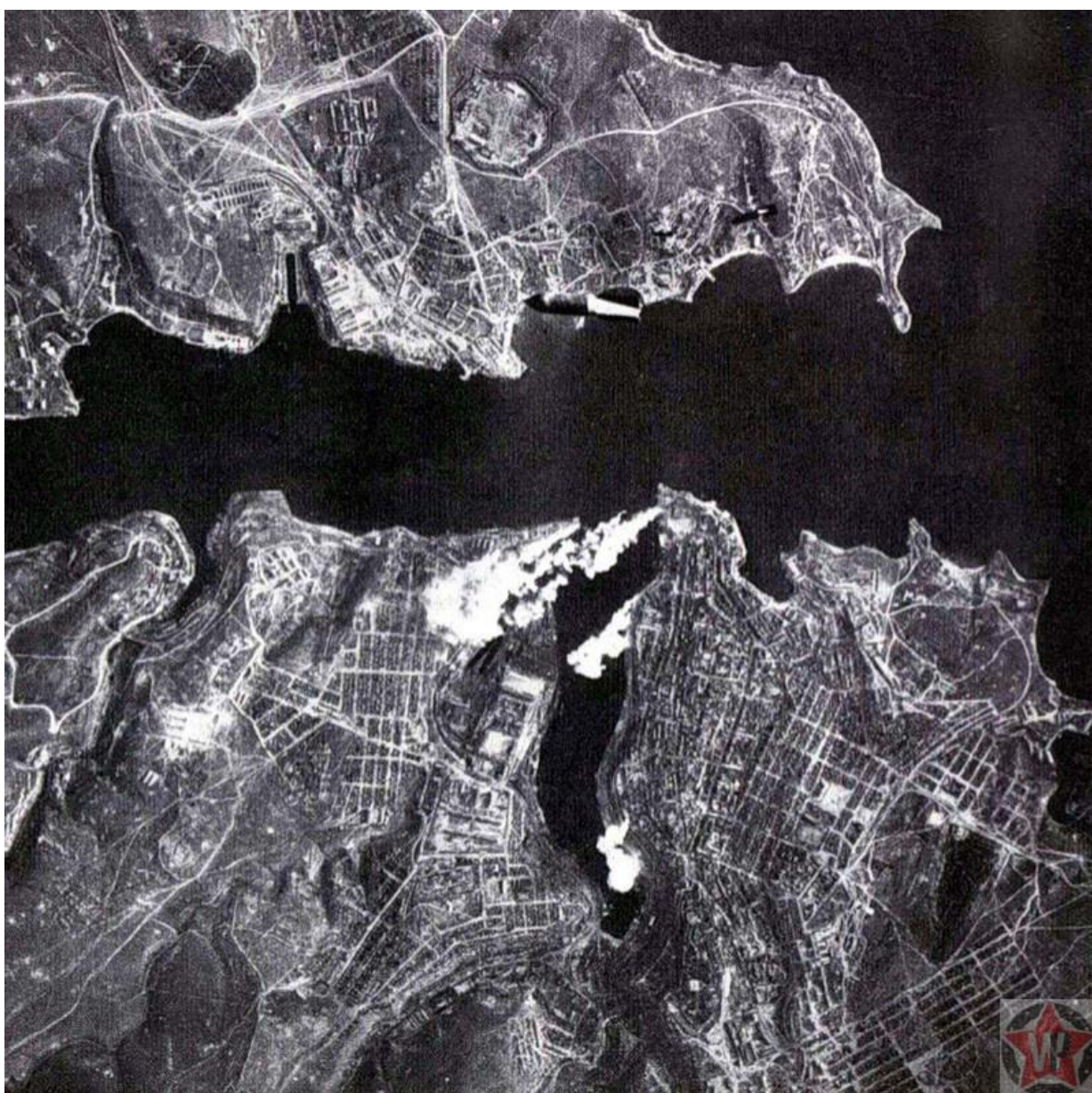
Немецкая бомба падает на Севастополь, 1941 год

Атаку на Севастополь немецкая авиация осуществила в первый день ВОВ — 22 июня 1941 года. Для того, чтобы блокировать корабли Черноморского флота в Севастопольской бухте, вражеские самолеты сбросили магнитно-акустические морские мины. Бомбардировки города проводились почти каждые сутки. Появились первые жертвы среди гражданского населения.