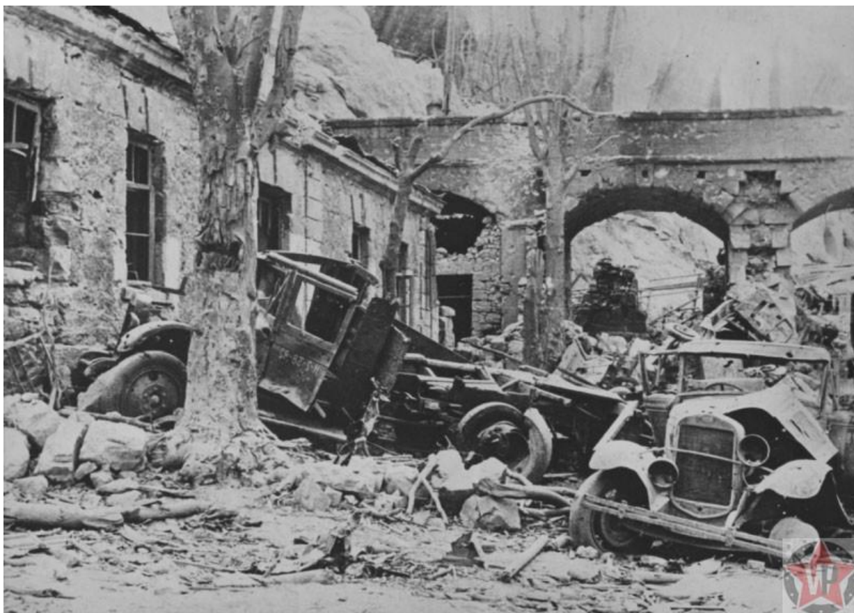
Улицы Севастополя после бомбового удара

Немецко-фашистское командование планировало возобновить штурм города 27 ноября. Операцию пришлось отложить, так как вследствие погодных условий и действий партизан было нарушено снабжение 11-й армии. Из строя вышли 4 из 5 паровозов, принадлежавших неприятелю и почти половина авто-гужевого транспорта.