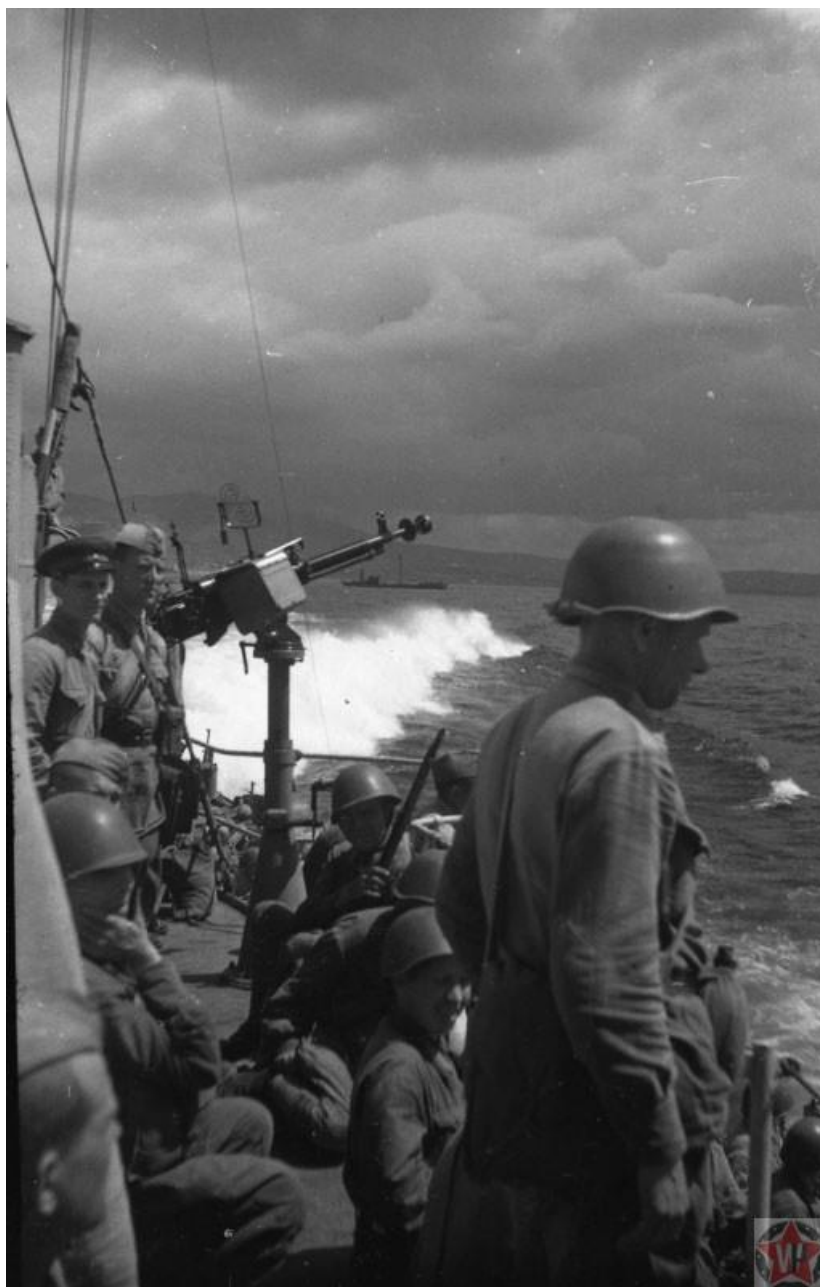
Эсминец «Ташкент» идет в Севастополь

В этот же период противник предпринял активные меры против Черноморского флота. Для этой цели неприятель использовал торпедные катера, сторожевые катера и подводные лодки, которые базировались в Евпатории и Ялте. Значительную роль играла авиация. По плану немецкого штаба морская блокада должна была ослабить защитников и облегчить взятие города. Без подвоза подкрепления и боеприпасов Севастополь не мог долго сопротивляться, несмотря на опытность командования и героизм рядовых солдат и матросов. То количество снарядов, которое все же удавалось доставить в осажденный город, не покрывало расхода. Вследствие этого советским артиллеристам приходилось снижать плотность огня. Зенитная артиллерия не могла сбивать вражеские самолеты, из-за чего немцы усилили бомбардировки города.