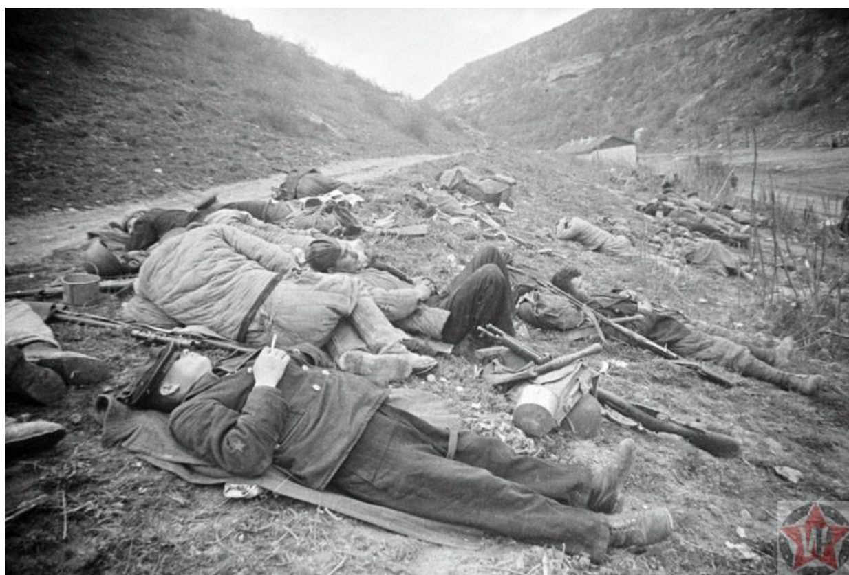
Бойцы КА на отдыхе, Севастополь 1942 год

1 июля немцы контролировали почти все побережье в районе Севастополя. Советские бойцы, зная о невозможности эвакуации, упорно сопротивлялись. Они уничтожали все стратегически важные объекты, оборудование заводов, склады, запасы продовольствия.