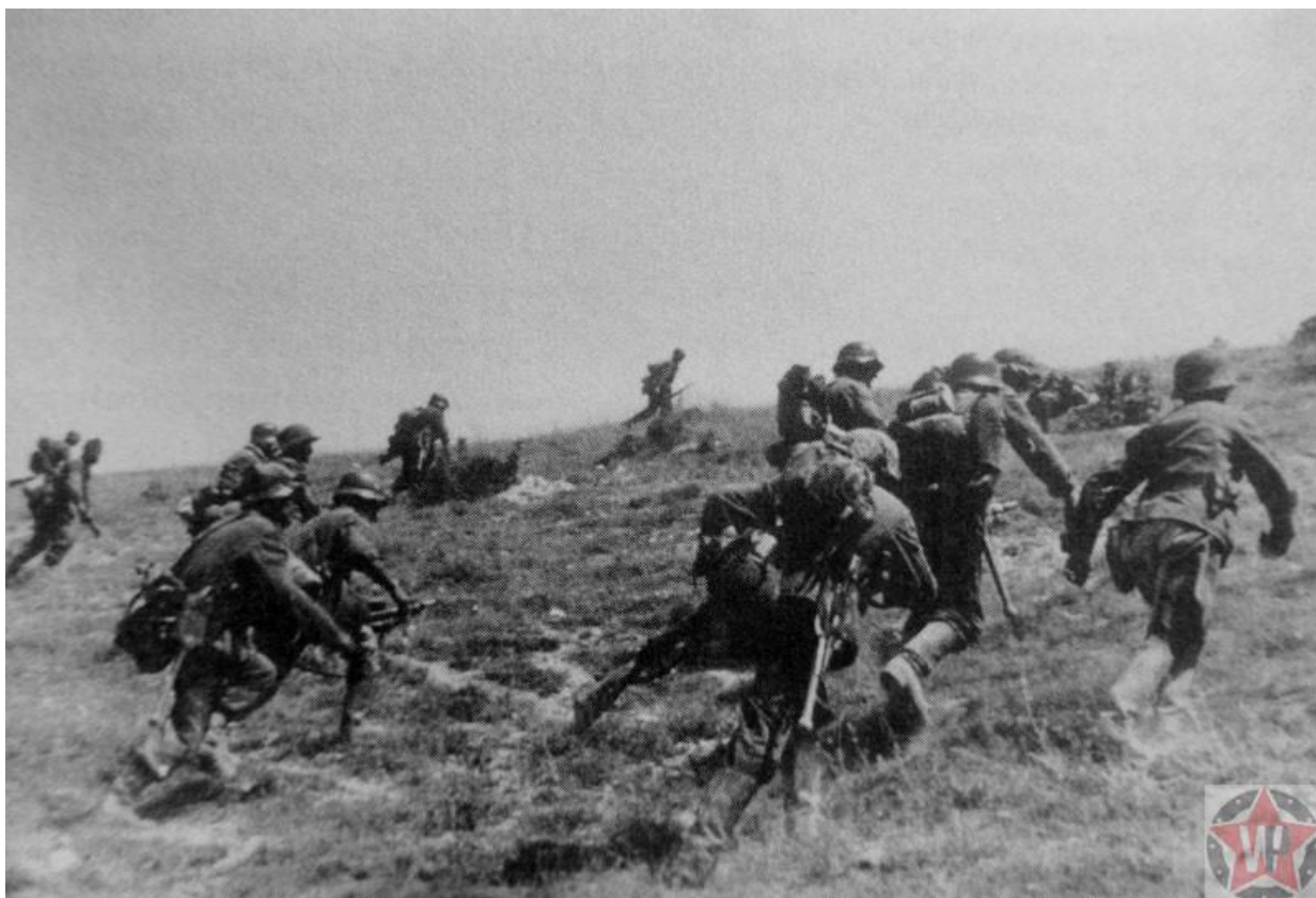
Атака солдат Вермахта позиций Красной Армии под Севастополем

Положение Красной армии на других фронтах в конце лета 1941 года было крайне сложным. Противник захватил большую часть Украины, в том числе Киев. К середине сентября 1941 года немецко-фашистские войска оказались на подступах к полуострову. Было принято решение отозвать вооружённые силы, защищавшие Одессу, для участия в обороне Севастополя.