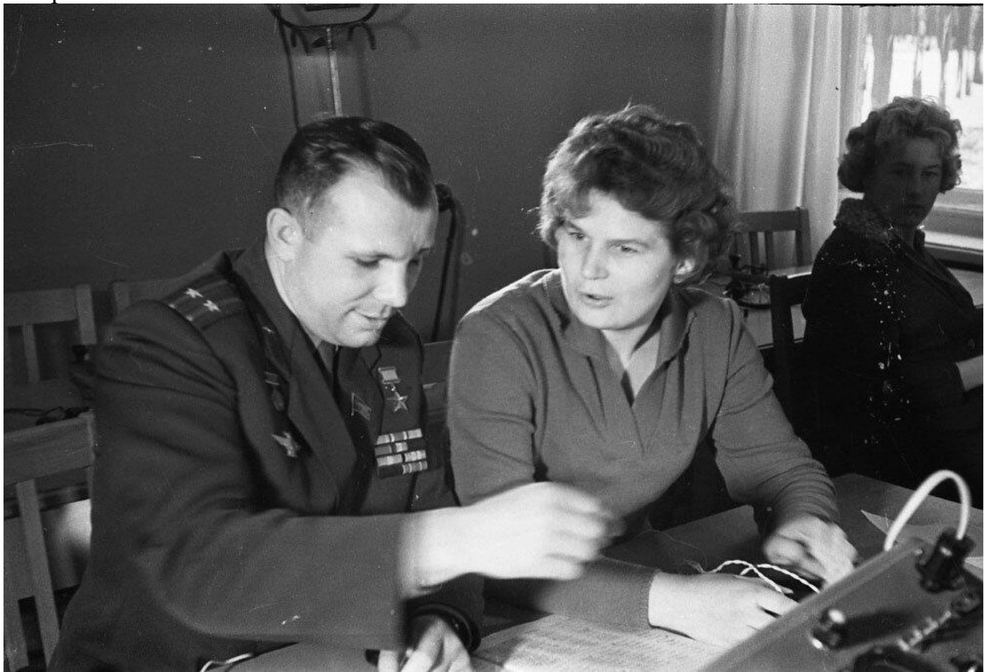
Юрий Гагарин и Валентина Терешкова

Об этом инциденте Терешкова не сообщала никому в течение 40 лет, по просьбе Сергея Королева.