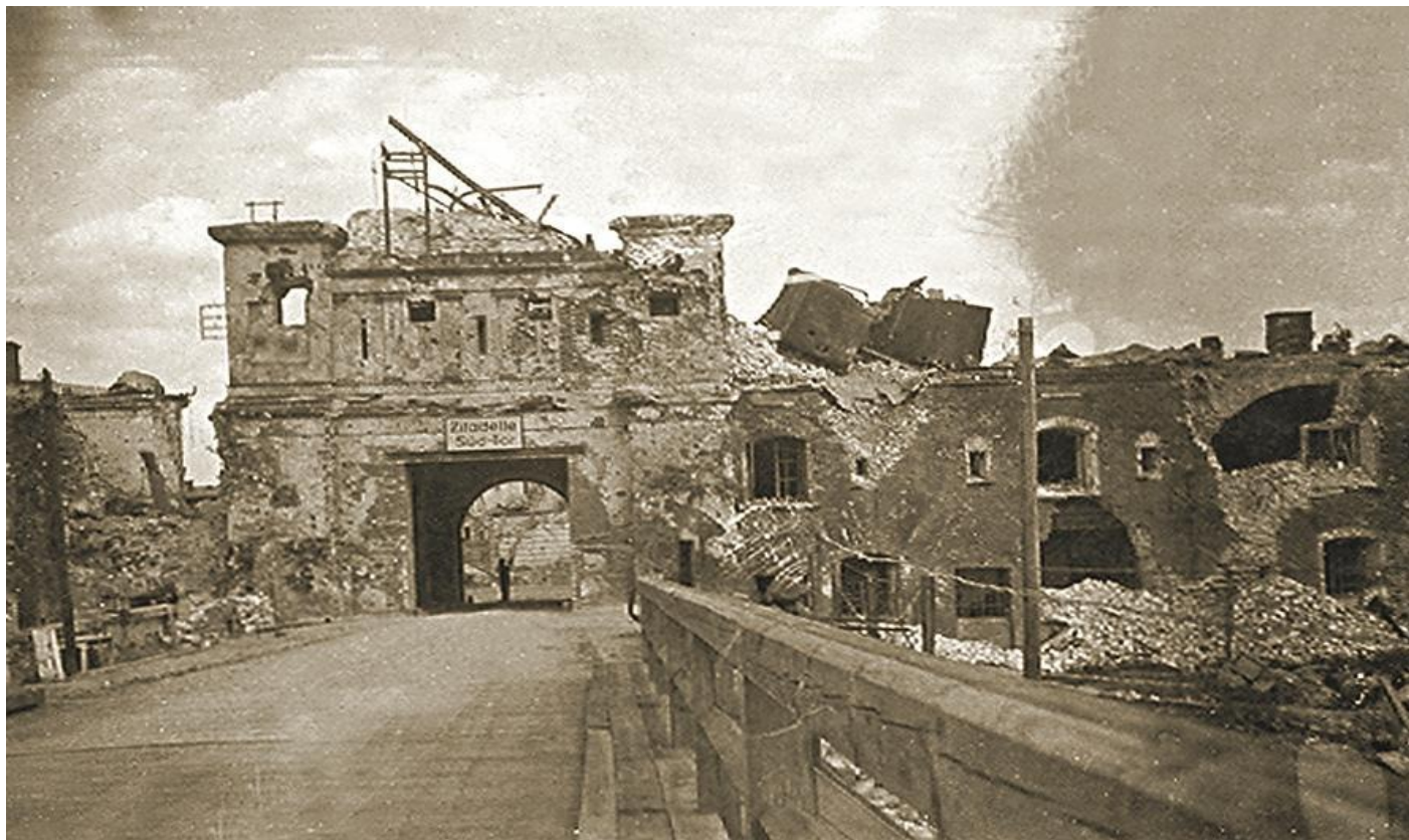
Брестская крепость после штурма.

История брестской крепости началась в XIX веке – в качестве укреплённого пункта на западных рубежах Российской империи. В годы революционного хаоса и гражданской войны часть российских территорий (в том числе и Брест) заняла Польша. В 1939 году Западная Белоруссия, вместе с Брестом, была присоединена к Советскому Союзу.