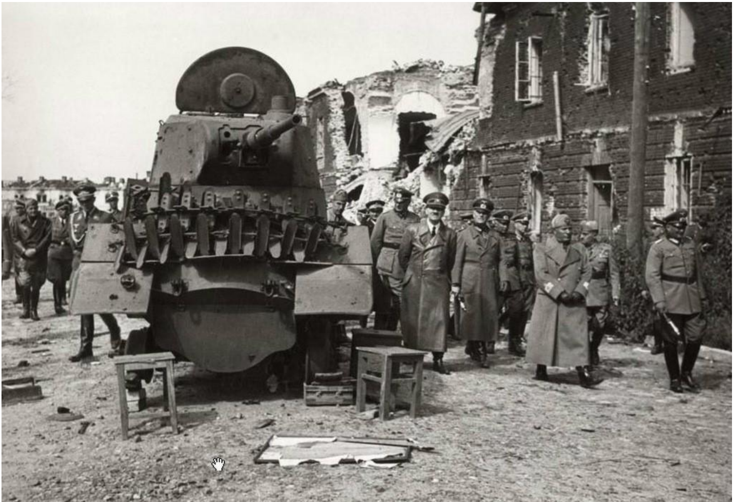
В августе 1941-го руины взятой Брестской крепости приезжали осматривать Гитлер и Муссолини

Благодаря вероломству и неожиданности их нападения, единого скоординированного сопротивления гарнизон оказать был не в состоянии, но и разбитый на несколько отдельных очагов сопротивления, он сражался яростно. Немцы понесли серьёзные потери и поняли, что оборона Бреста будет упорной. Они с удивлением убедились в том, что многие советские солдаты продолжают драться даже в самой безнадёжной ситуации, даже не рассматривая такого варианта, как плен.