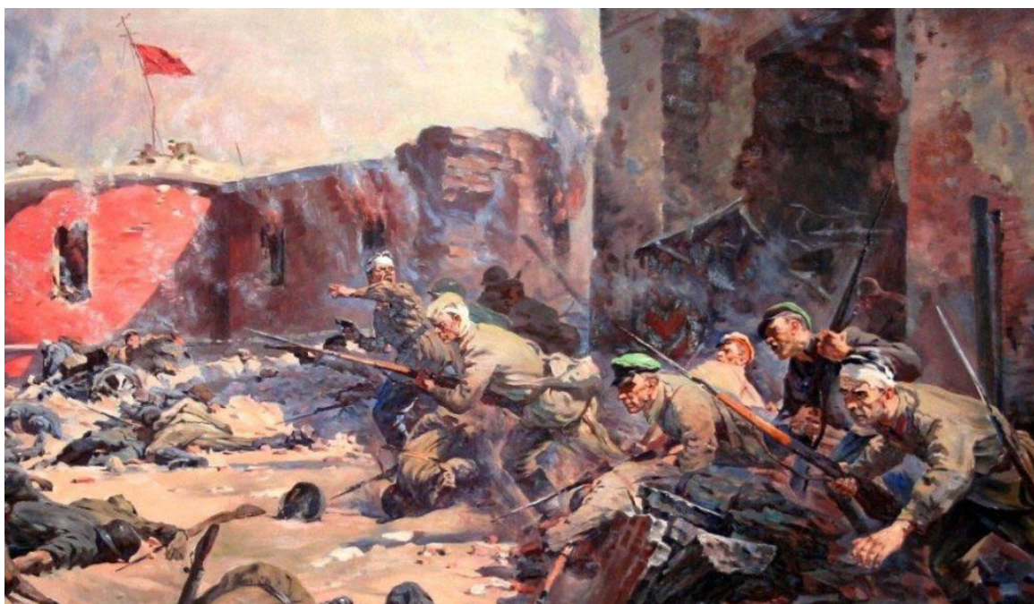
Картина Петра Кривоногова «Защитники Брестской крепости»

Только ценой огромных усилий и потерь немцы взяли Брест. Оборона 1941 года наглядно показала, что блицкриг ждёт в Советском Союзе провал. Наши войска потеряли при обороне крепости около 1,5 тысяч человек убитыми и 7223 человека пленными, 80% из которых погибли в плену. Агрессоры были поражены смелостью защитников Брестской крепости и отвагой, с которой те дрались.