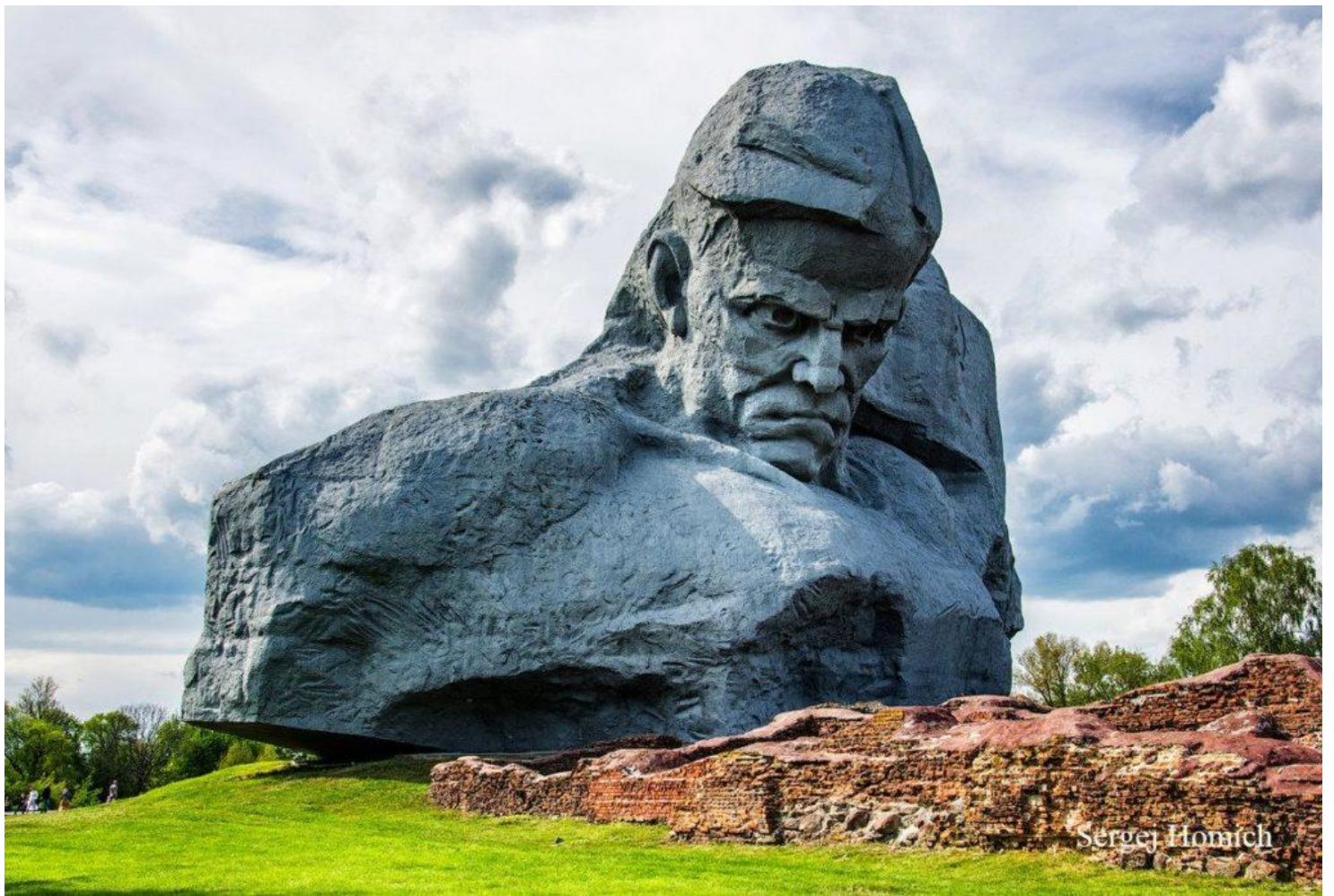
Памятник «Мужество» в крепости-герое Бресте