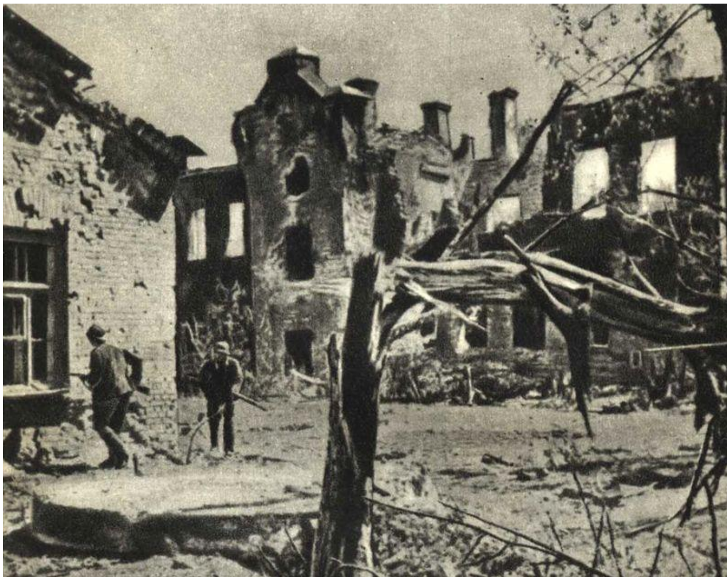
Немецкие солдаты внутри цитадели

1941 года к началу Великой Отечественной крепость, разумеется, уже не выполняла функций военного укрепления. Её постройки использовали как казармы, госпиталь и жилые помещения. Когда вермахт напал на Брест, в крепости размещалось около 8 тысяч военнослужащих, около трёхсот офицерских семей, много медицинского и обслуживающего персонала.