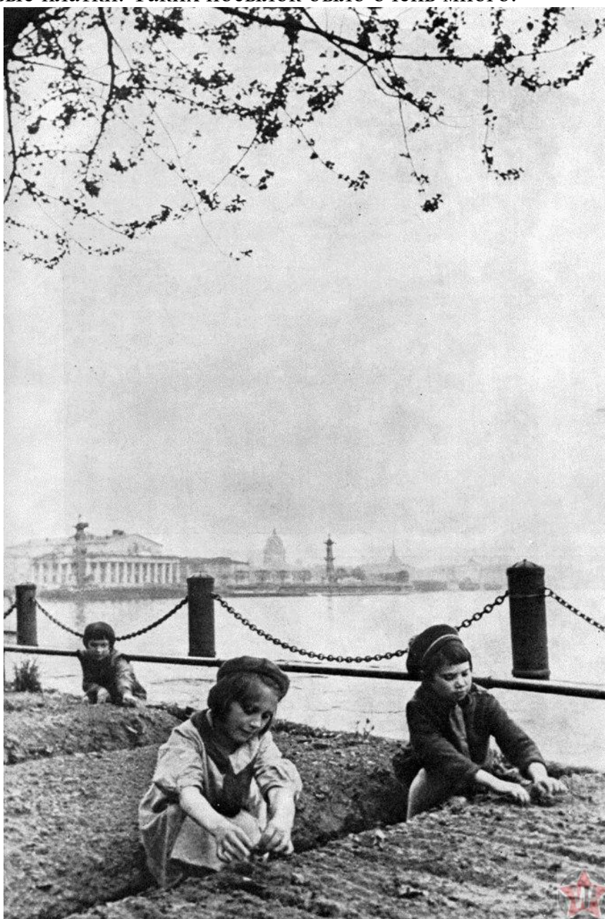
Дети блокадного Ленинграда у грядок на Мытнинской набережной

Потом пришёл черед сбора тёплых вещей для нужд армии. На этот раз простыми обходами дети не ограничились. Они сами вязали тёплые свитеры и носки, которые потом отправляли бойцам на фронт. Кроме того они писали письма и посылали солдатам маленькие подарки – блокноты, карандаши, мыло, носовые платки. Таких посылок было очень много.