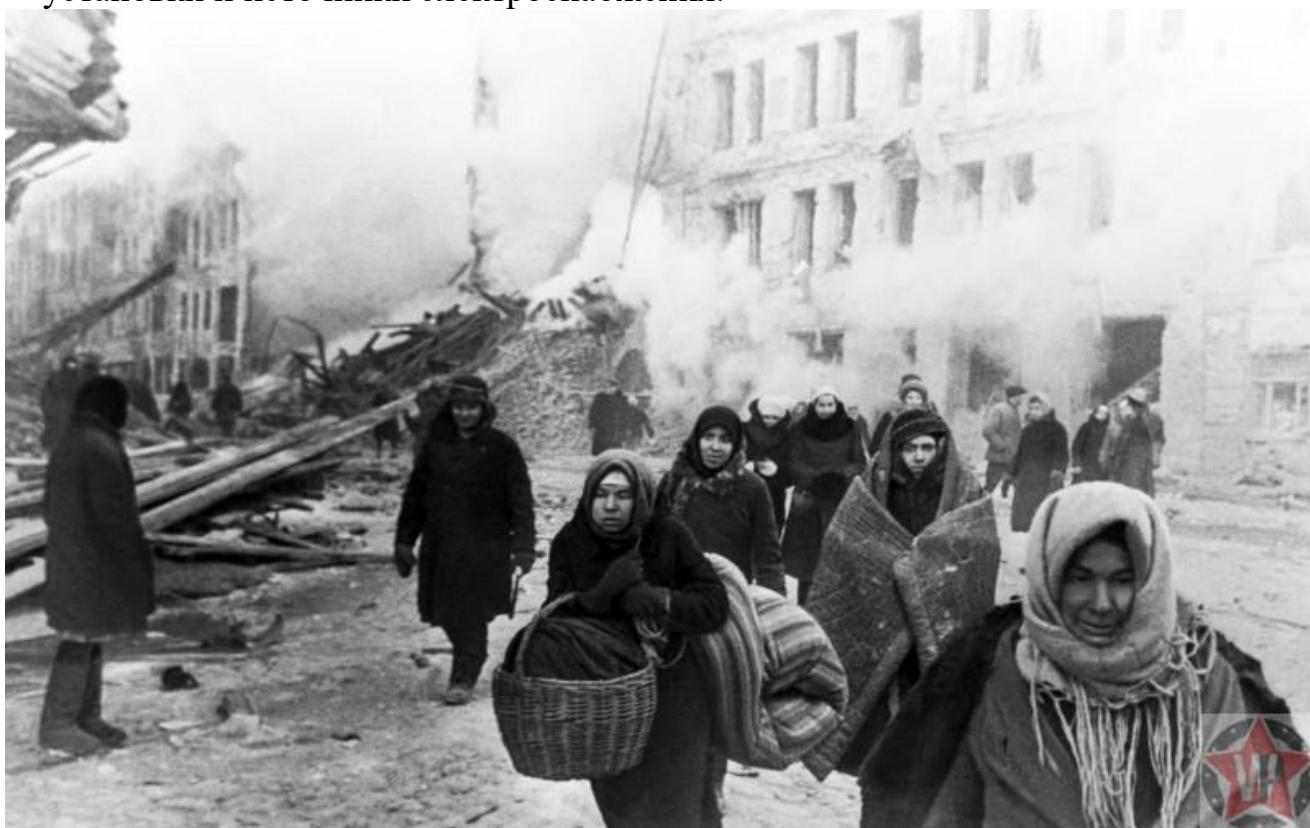
Жители Ленинграда покидают свои дома, разрушенные немецкими войсками

Планы Гитлера не были известны широкой общественности. И ленинградская героическая оборона так и останется по-настоящему героической. Но сегодня, имея документы и свидетельства очевидцев, доподлинно известно, что для жителей Ленинграда не было шансов во время вражеской блокады сохранить жизнь, просто сдав город и вверив себя милости победителя. Этому победителю не нужны были пленные. У немецких военачальников были недвусмысленные приказы сломить сопротивление, разрушая ударами артиллерии склады, водопроводные станции, силовые установки и источники электроснабжения.