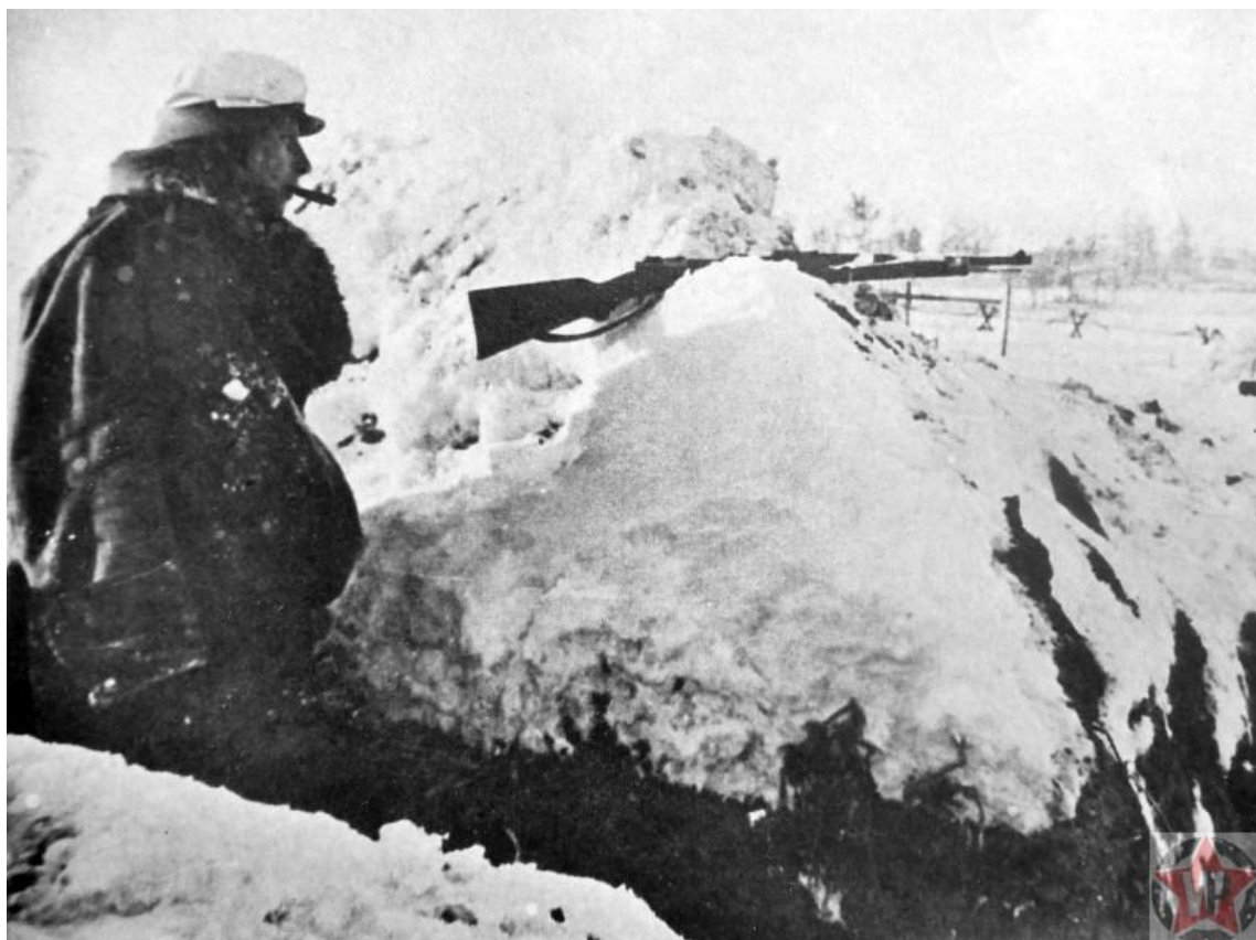
Немецкий солдат в окопе под Ленинградом

А пока немецкое руководство строило планы, а ещё опьянённая успехами прошлых кампаний и гладким началом нынешней, немецкая армия браво продвигалась к намеченным целям, советские войска спешно воздвигали оборону и готовили эвакуацию. Ленинградцы к возможности эвакуироваться относились довольно прохладно. Они неохотно покидали дома. А вот к призыву помочь частям Красной армии в обороне, напротив, отнеслись с большим энтузиазмом. И стар, и млад предлагали свою помощь. Женщины и мужчины охотно соглашались работать на подготовке оборонительных сооружений. После призыва сформировать народное ополчение, военкоматы были буквально завалены тысячами заявлений.