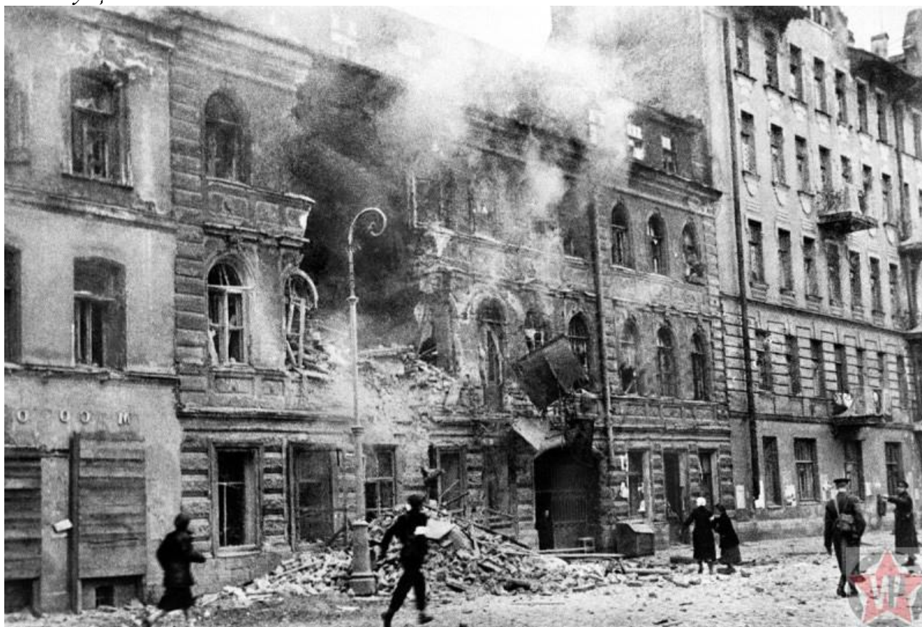
Ленинградская улица после окончания немецкого артобстрела

И ведь такие попытки были. Спасавшиеся поодиночке люди приходили буквально в немецкие окопы. Их просто выталкивали обратно, чтоб возвращались туда, откуда пришли. Таков был приказ. Позиция Гитлера в этом вопросе была последовательной. Он собирался истребить славян, а сейчас представилась возможность это сделать. Тут на кону была уже не просто военная победа и раздел территорий. Речь шла о продолжении существования миллионов людей.