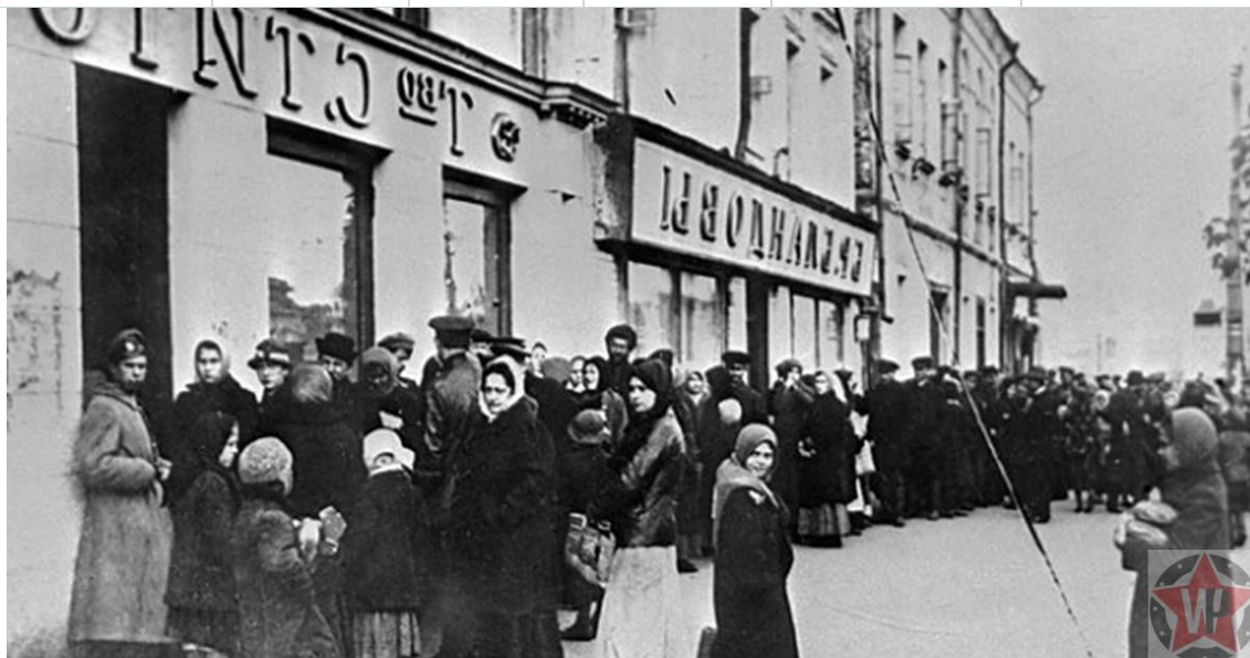
Ленинградцы в очереди за хлебом

Но в этих условиях люди продолжали работать. Кировский завод, производивший танки, выпускал продукцию во время блокады. Дети ходили в школу. Работали городские службы, в городе поддерживался порядок. Даже сотрудники институтов приходили на работу. Позже, пережившие блокаду очевидцы, расскажут, что выживали именно те, кто продолжал вставать по утрам с кровати и что-то делать, придерживаться какого-то графика и ритма. Их воля к жизни не угасала. А те, кто предпочитал экономить силы, прекратив выходить из дома, чаще всего быстро умирали в собственных жилищах.