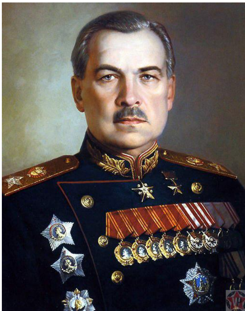
Леонид Александрович Говоров

В то же время, Говоров не был просто теоретиком. Он лично инспектировал оборонительные сооружения, создававшиеся по его проектам. Если по проверяемым им траншеям нельзя было спокойно пройти, не пригибаясь, командующие, ответственные за этот участок, лично имели дело с суровым начальством. Результаты не заставили себя ждать. Потери от пуль вражеских снайперов и осколков снарядов резко пошли на убыль.