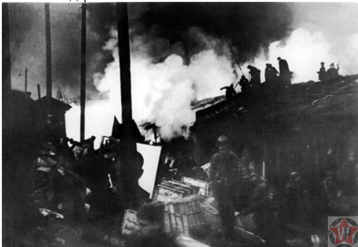
Пожар на Бадаевских складах

В самом начале немцам удалось бомбами поджечь Бадаевские склады. Там сгорели сахар, мука и масло. Этот грандиозный пожар видели многие ленинградцы, и они прекрасно понимали, что это для них означало. Даже бытовало мнение, что голод начался именно из-за этого пожара. Но на этих складах не было достаточно продуктов, чтобы обеспечить горожан. В то время в Ленинграде проживало около трёх миллионов человек. А сам город всегда зависел от привозных продуктов. В нём просто не было автономных запасов. Теперь же снабжение блокадного населения ленинградцев продовольствием осуществлялось по Дороге жизни.