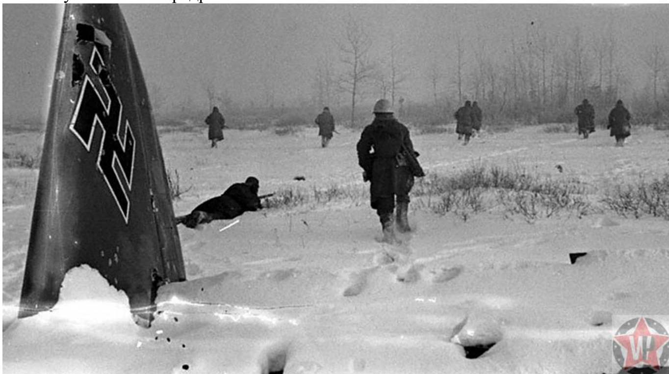
Передвижение немецких солдат под блокадным Ленинградом

Когда пришёл приказ начать блокаду, солдаты вермахта даже несколько приуныли. Длительное нахождение в холодных окопах очень отличалось от расквартировки в уютных французских домиках. Своё решение Гитлер мотивировал тем, что таким образом будут сэкономлены военные силы. Надо просто подождать пока в городе начнётся голод. И помочь в этом, разрушая артиллерийским огнём продовольственные склады. Огонь следовало вести мощно, массированно и регулярно. Беречь город никто не собирался. Его участь была предрешена.