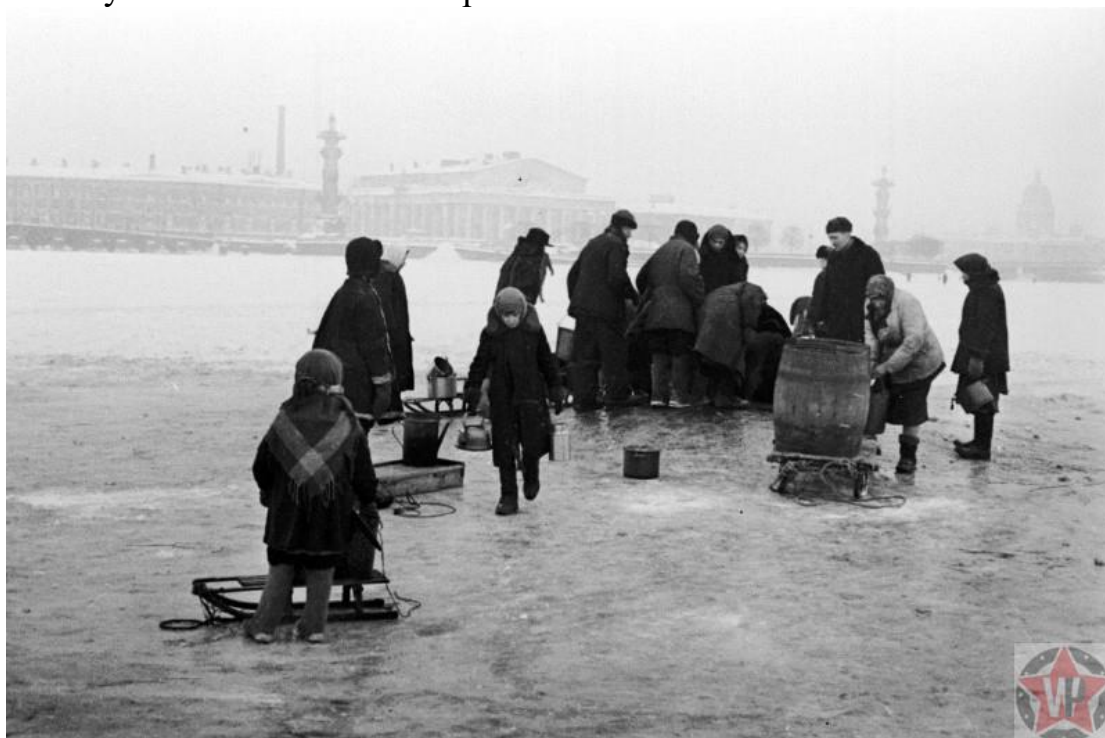
Жители блокадного Ленинграда идут на Неву за водой

Ленинград географически оказался как-бы на окраине сражавшейся страны. Прибалтику немцы захватили очень быстро. Это закрыло западную сторону. С севера наступала Финляндия. На востоке раскинулось широкое и очень капризное в плане судоходства Ладожское озеро. Поэтому для того, чтобы окружить кольцом блокады Ленинград, было достаточно захватить и удерживать буквально несколько стратегически важных точек.