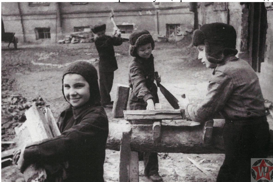
Дети за работой в блокадном Ленинграде

Но и этим вклад детей в защиту родного города, в то время как продолжалась блокада, не ограничивается. Они, голодные и обессиленные становились за станки, чтобы заменить, ушедших на фронт, отцов и братьев. А порой и принять эстафету рабочего, умершего от истощения. Они выстаивали полные смены, стремясь не отставать от нормы квалифицированного рабочего, а порой и превышая её. Они добровольцами шли на строительство оборонительных сооружений. А ведь большинству лопаты да кирки знакомы были чуть ли не только по картинкам. Они рыли окопы и обеспечивали блокирование улиц противотанковыми надолбами.