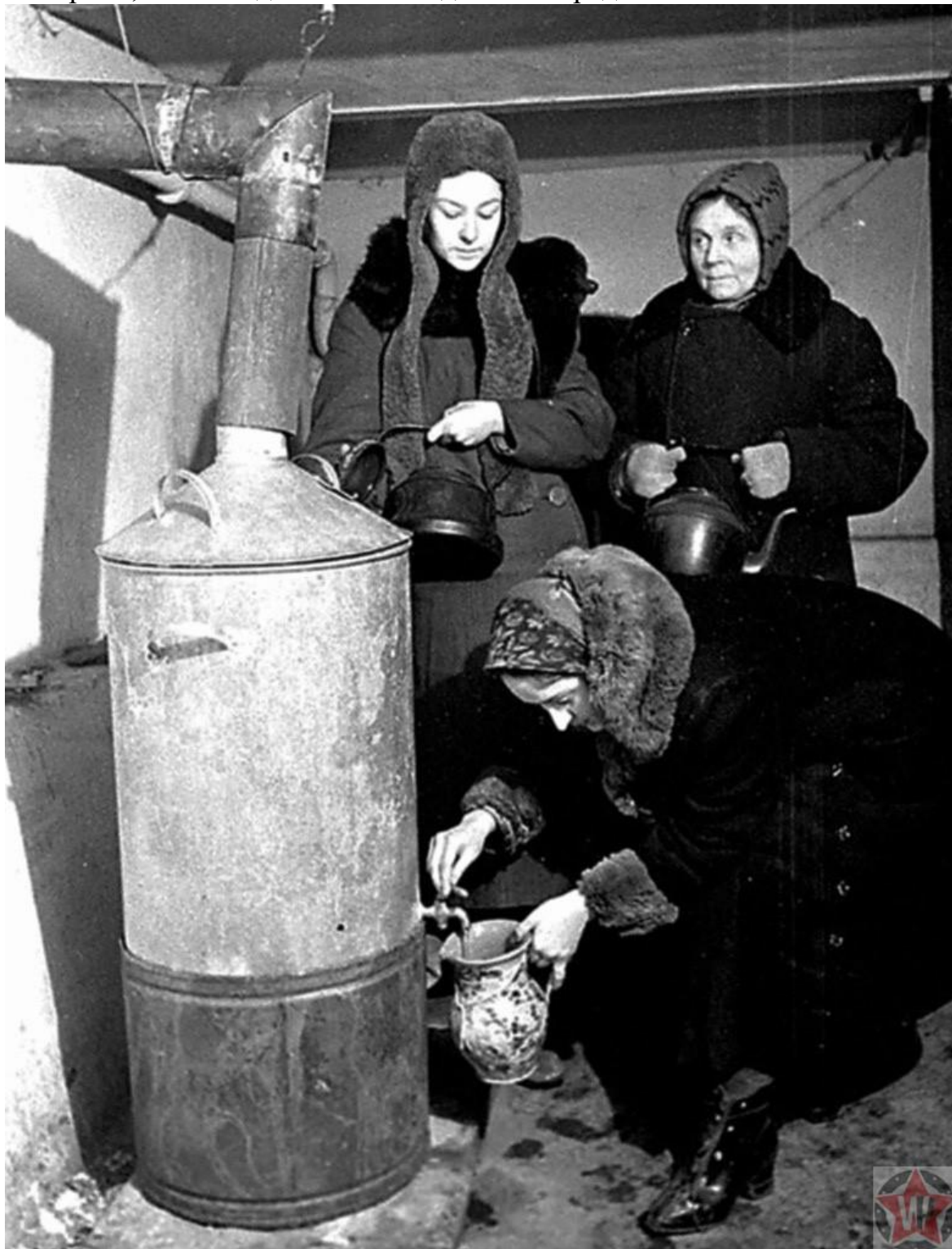
Жительницы блокадного Ленинграда набирают кипяток во время нахождения в бомбоубежище

оказавшись в безвыходном положении и перенося страдания, человек теряет волю к борьбе. Но русские её не теряли. И эта аксиома очередной раз была доказана блокадным Ленинградом. Не гениальными штабными офицерами. Не профессиональным умением полководцев. А простыми людьми. Которые не утратили воли к жизни. Которые продолжали бороться изо дня в день всё то время, сколько длилась блокада Ленинграда.