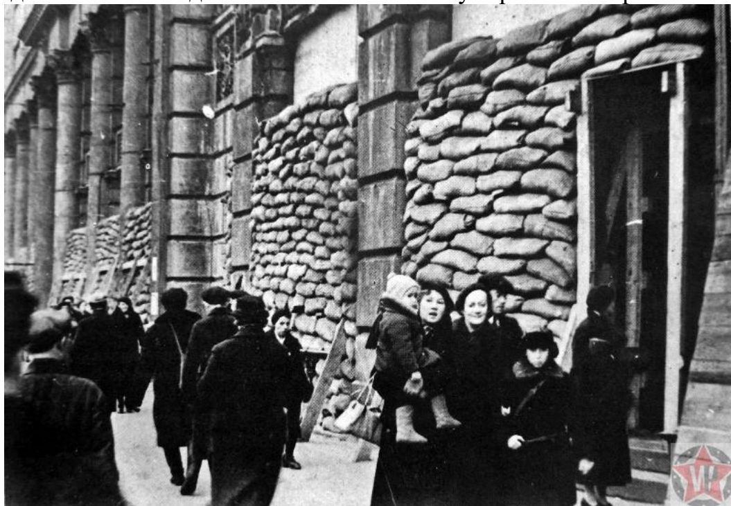
Жители на улице блокадного Ленинграда у зданий

Когда в 1941 году Германия напала на Советский Союз, советское руководство понимало, что Ленинград обязательно будет одной из ключевых фигур на сцене разворачивающихся военных действий. Он приказал организовать комиссию по эвакуации города. Необходимо было вывезти население, оборудование предприятий и военные грузы. Однако блокады Ленинграда никто не ожидал. Не та тактика была у германской армии.