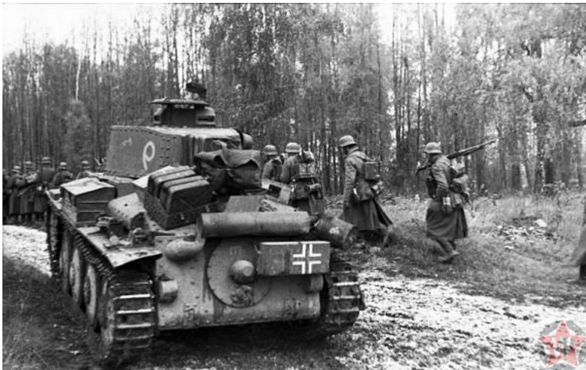
«На Москву» — германская пехота и лёгкий танк 20-й танковой дивизии

Германия напала на Советский Союз вопреки заключённому договору и без предупреждения. Поэтому ни пограничники, ни регулярные войска, ни резервы готовы не были. Это дало немецкой армии большое преимущество на первых порах. На что Гитлер и рассчитывал. Успех всей кампании напрямую зависел от стремительности и скорости передвижения. Но, несмотря на значительные успехи, с самого первого дня уже начались досадные проволочки.