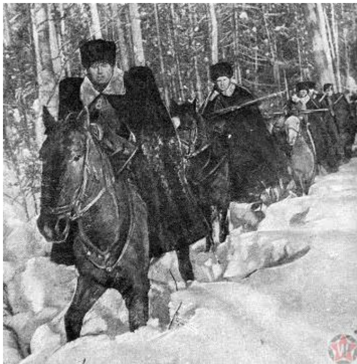
Подвиг кубанских казаков 19 ноября 1941 года

Девятнадцатое ноября – подвиг кубанских казаков в битве за Москву. На Волоколамском направлении казаки-кубанцы кавалерийского полка, ценой своих жизней задержали немцев и уничтожили 25 танков противника, не имея никакого тяжёлого вооружения.