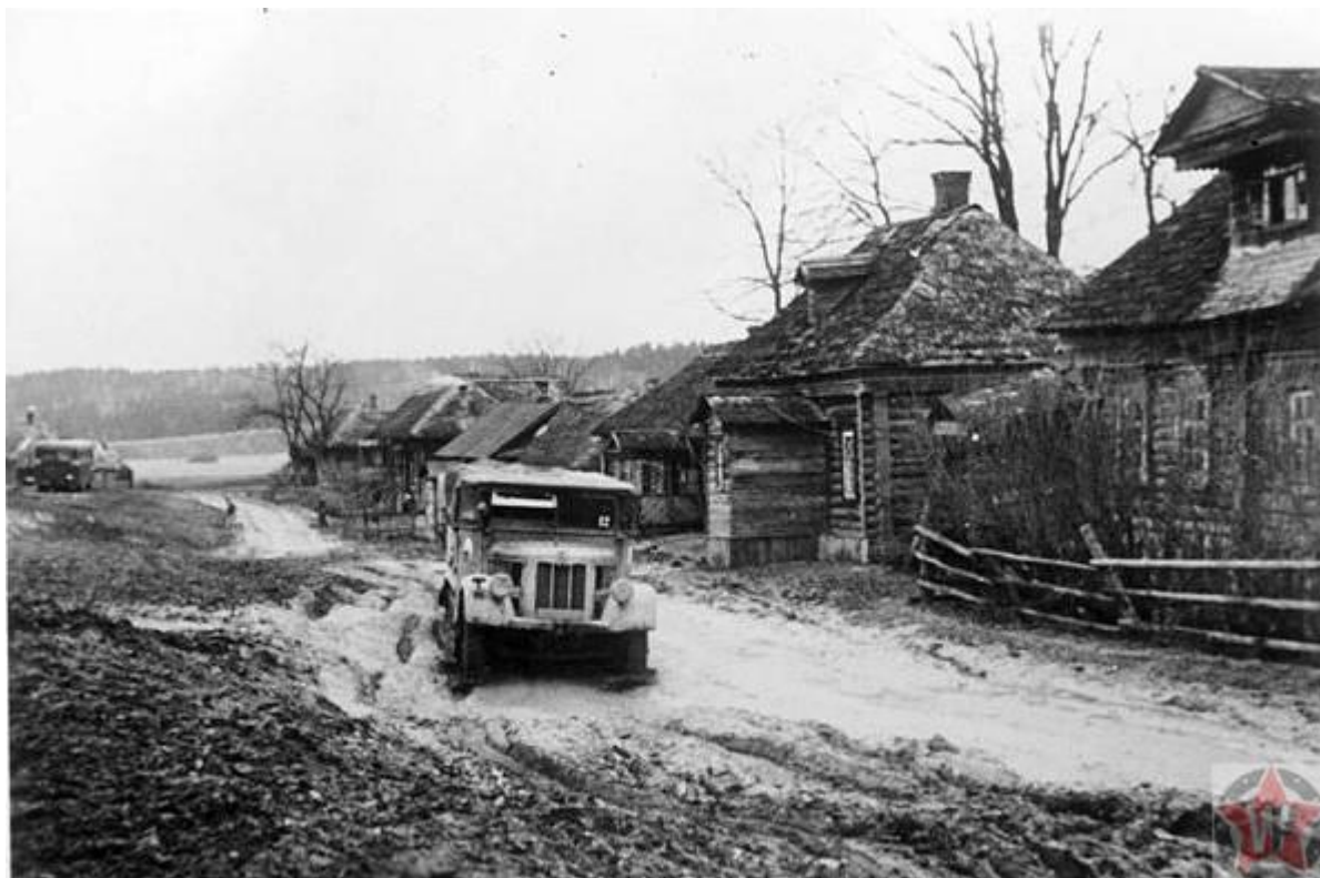
Трудные дороги Советского Союза

Восемнадцатого октября 1941 года начинаются проливные дожди, серьёзно тормозящие продвижение немецкой армии. Из-за сложностей с передвижениями, колонна бронетехники сильно растягивается, становясь более уязвимой. Бойцы чувствуют перебои в обеспечении продуктами питания, боеприпасами и топливом.