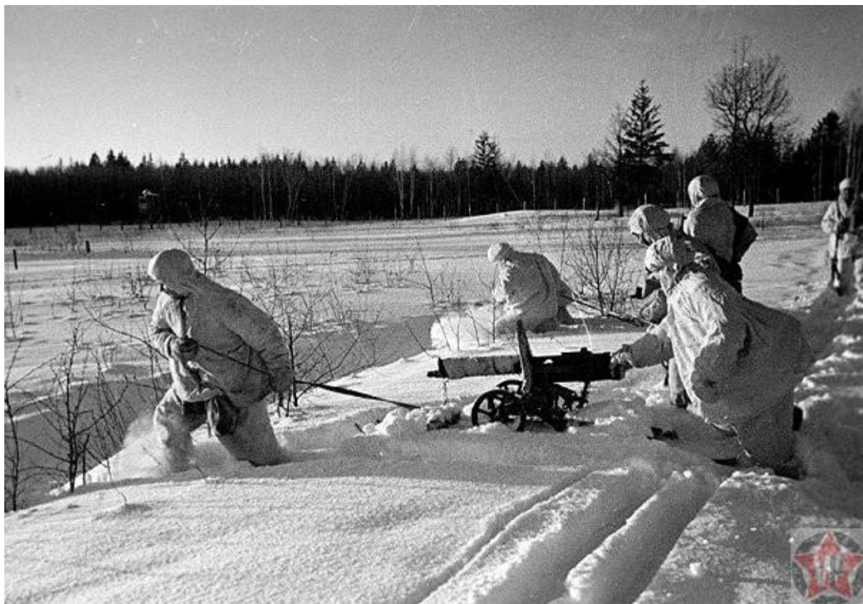
Контрнаступление: бойцы пулеметного подразделения передвигаются к переднему краю

войск прорваться на флангах и обойти занимаемые позиции с тыла. Но офицеры не слушали приказа.