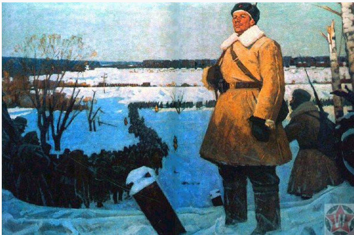
«Москву отстояли» А. Лысенко 1965 год

существенно ускорили создание антифашистской коалиции, и повлияли на ход всей Второй мировой войны. Психологический перелом произошёл не только у солдат. Гражданское население как Советского Союза, так и Германии тоже почувствовало усиление сомнений в успехе захватнических планов Гитлера. И немаловажно, что чувство это поселилось не просто у рядовых граждан, но и у немецкого военно-политического руководства.