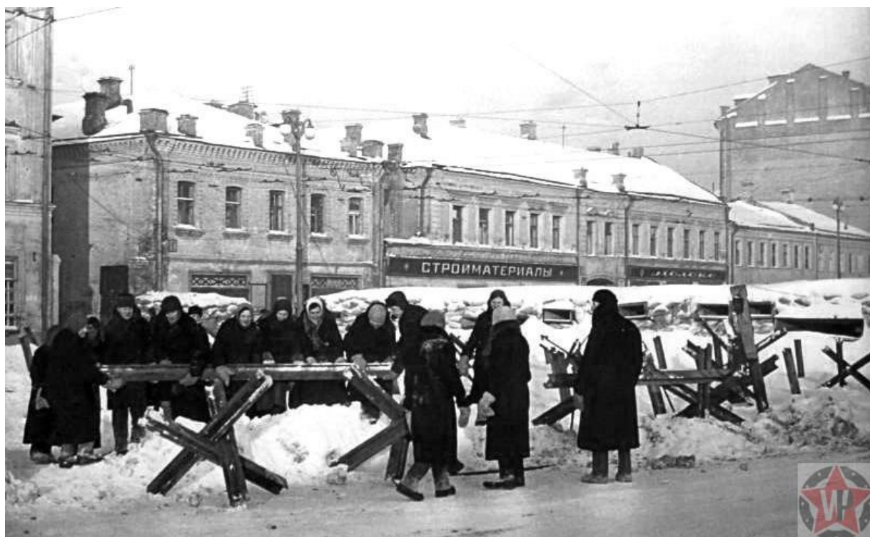
Строительство баррикад в Москве