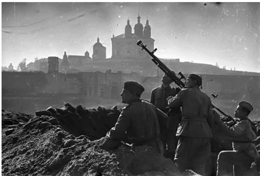
Смоленское сражение (июль-август 1941 год)

Именно с такой целью началось Смоленское сражение. Здесь немцы планировали быстро добиться успеха тактикой «разделяй и властвуй»: силы советских армий разделить на три равных окружённых лагеря, что обеспечит их быструю капитуляцию. Тогда дорога на Москву будет открыта и даже слабые дивизии, разбросанные в тылу фронта, не смогут воспрепятствовать прохождению германских войск. Хотя начало военных действий было неожиданным для Красной армии, очень скоро оборонительные сражения сменялись контрнаступлениями, из-за чего задачей войск стал если не захват столицы до конкретной даты, то до холодов.