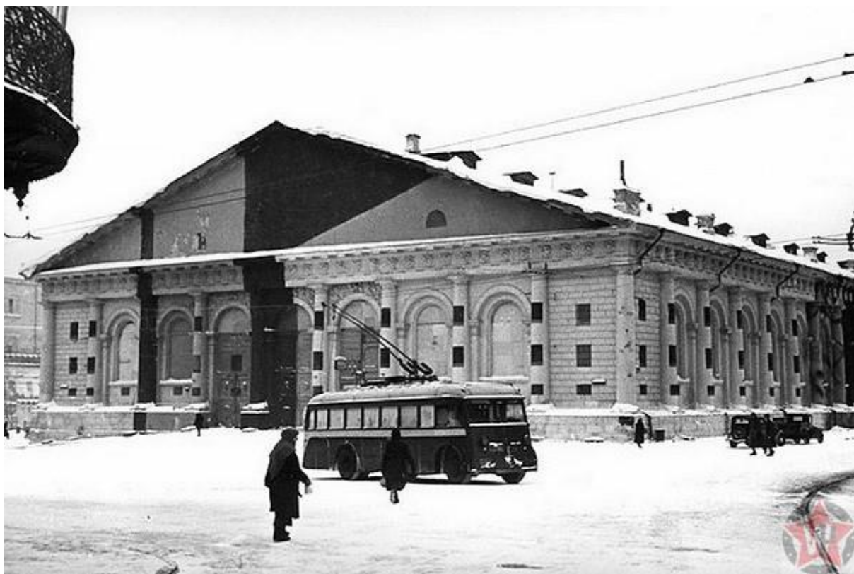
Закамуфлированное здание Манежа в Москве зимой 1941 года.

Фасады крупных зданий перекрашивали таким образом, чтобы он выглядел, как несколько построек, отстоящих друг от друга. На площадях возводили объёмные деревянные макеты. Вся кремлёвская стена была разукрашена под цвета городских кварталов. Дорогу между башнями засыпали песком. Над садовыми деревьями натянули брезент с нарисованными на нём крышами домов. Таким же брезентом была «пересечена» сама кремлёвская стена. Только на этот раз он был расписан под дорогу. Мавзолей прикрывало построенное над ним двухэтажное здание.