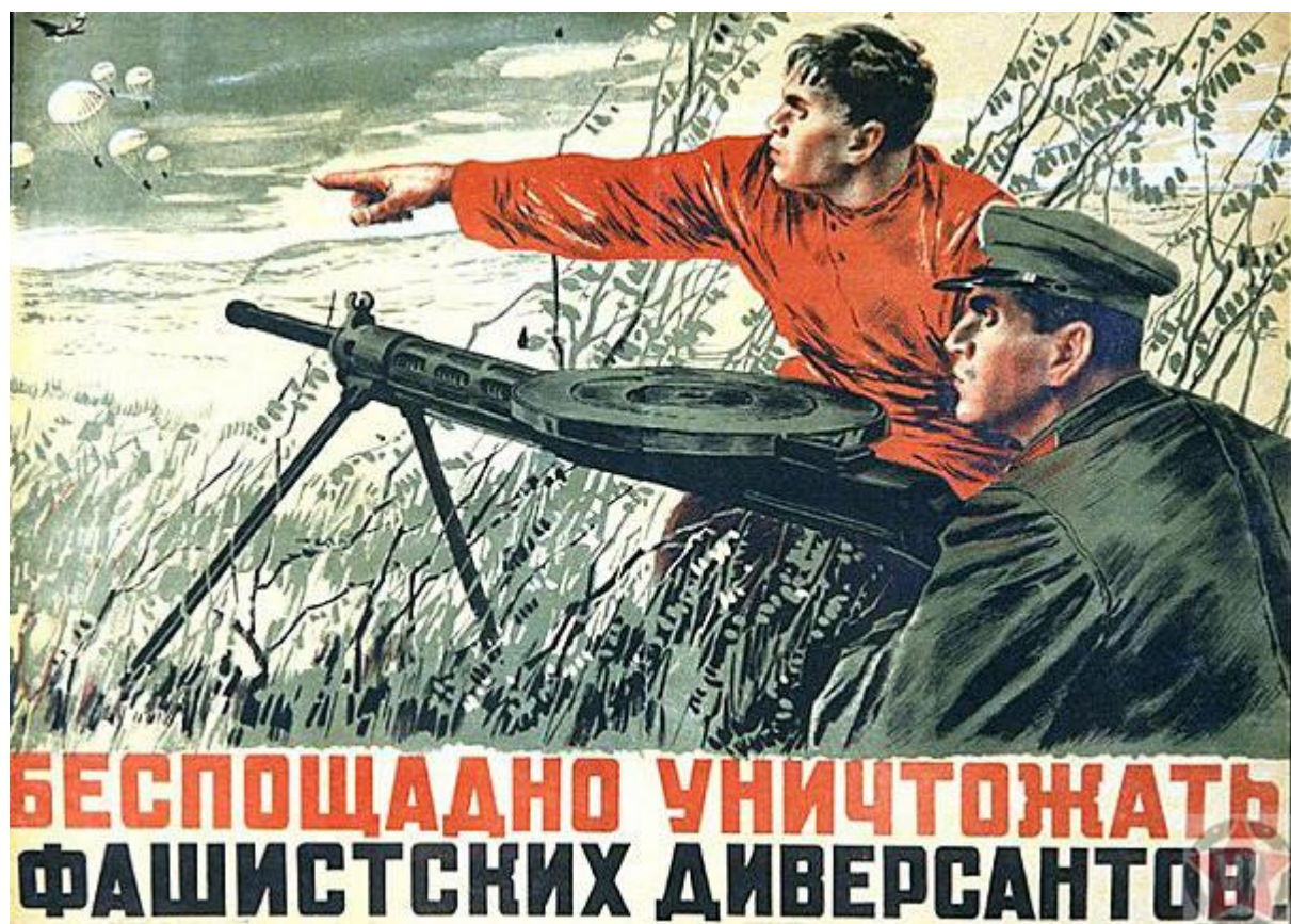
Плакаты на улицах столицы