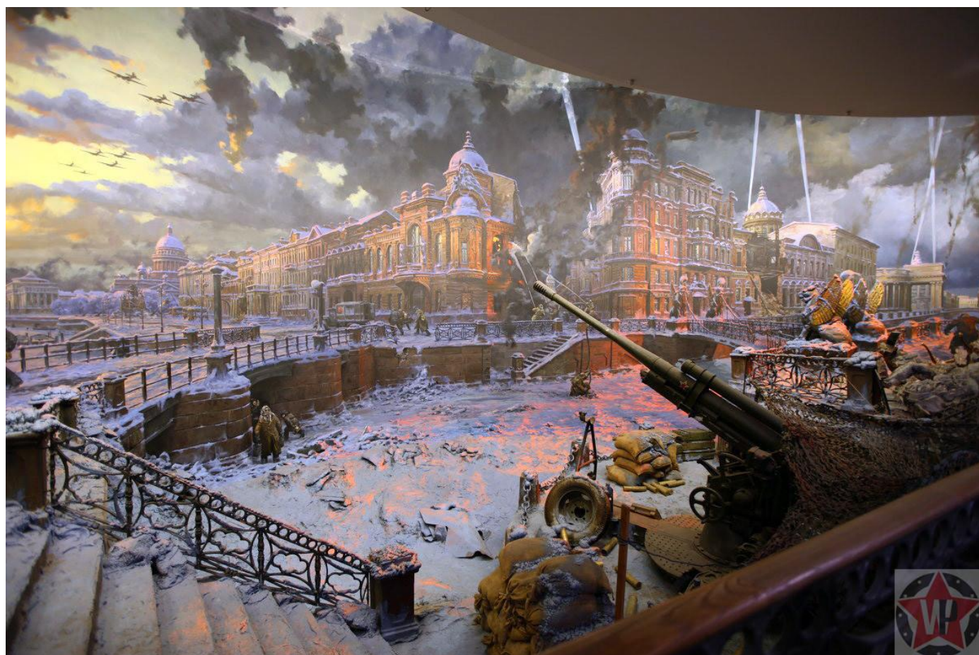
Диорама «Блокада Ленинграда»

Почти одновременно начались блокада Ленинграда и Киевская операция. Ленинград нужен был немцам как один из наиболее важных городов, поставляющих противнику новейшие разработки машиностроения и электротехнику. Перекрыв путь к городу, немцы спровоцировали голод. Также сказывался недостаток отопления – осада затянулась до зимы, и холод стал ещё одним врагом для солдат. После этого изменилась тактика: самолёты бомбили продовольственные склады, фабрики и заводы, чтобы уничтожить важные для города центры. По плану, после захвата Ленинграда войска встречались с группой, которая захватывала Киев. Здесь важной была переправа через Днепр, однако на реке немецкие войска встретили жестокое сопротивление.