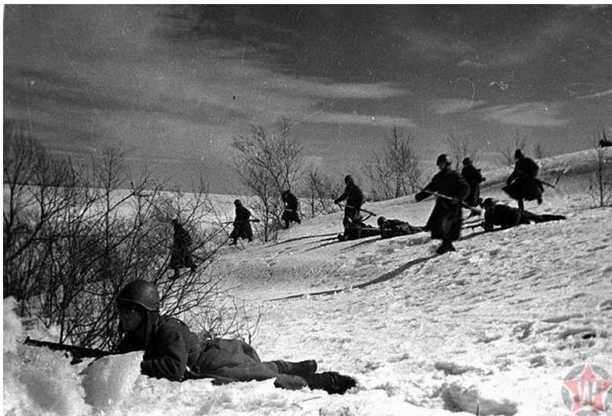
Бойцы 1-й гвардейской мотострелковой Московской дважды Краснознаменной дивизии атакуют противника

Но первых заморозков не пришлось долго ждать. В начале ноября наступление продолжилось по подмёрзшим дорогам. В Туле германские бойцы получил такой отпор, на который не рассчитывало даже Верховное командование Советского Союза. При ощутимой поддержке местного населения город смогли отстоять. Но Гитлер продолжал гнать свои войска вперёд. Им удалось занять Красную Поляну. Тяжёлые бои шли за Тулу и Каширы.