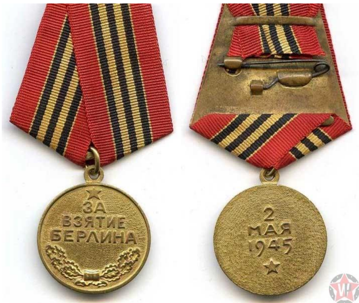
Медаль «За взятие Берлина»

Были награждены более миллиона человек. Кроме наших солдат, медали получили и военнослужащие войска польского, особо отличившиеся в боях. Таких наград, учрежденных за победы в городах за границами СССР, в общей сложности семь.