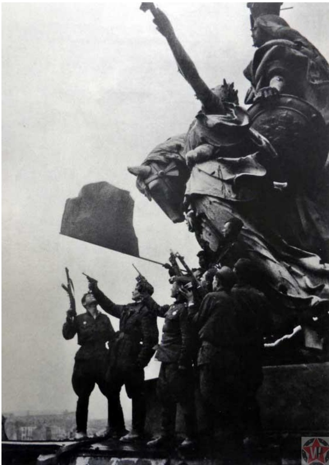
Салют в честь Победы на крыше Рейхстага