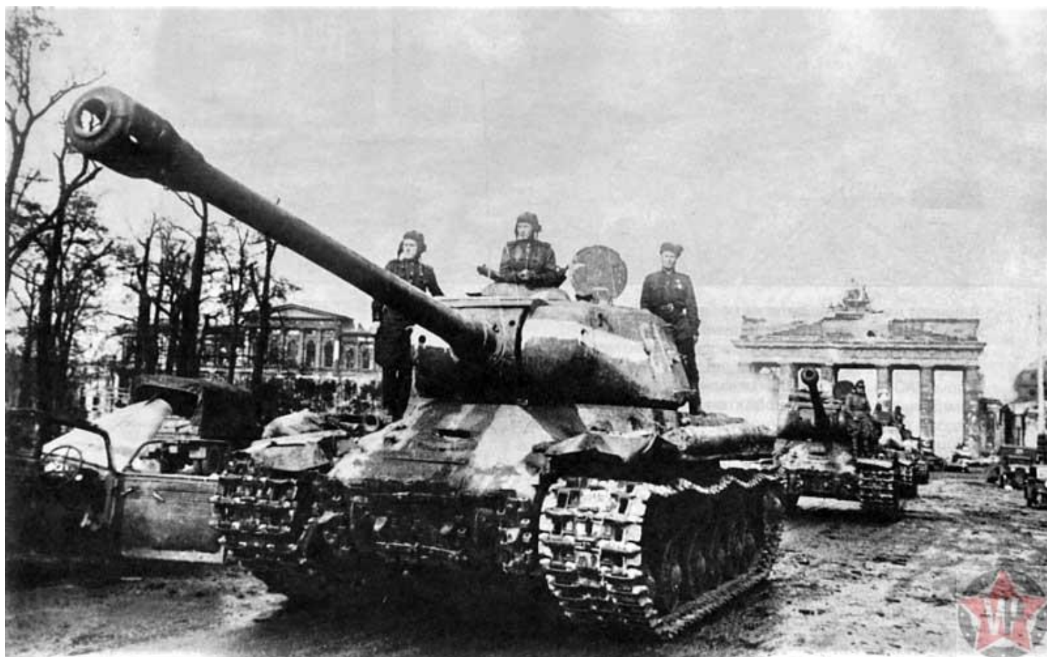
Колонна советских танков ИС-2 вблизи Бранденбургских ворот

Белоруссии и Украины танкистов Берлином было не испугать. Но применялись они только в плотном взаимодействии с пехотой. Одиночные попытки, как правило, приводили к потерям. С определенными особенностями применения столкнулись и артиллерийские подразделения. Часть их придавалась штурмовым группам для стрельбы прямой наводкой и стрельбы на разрушение.