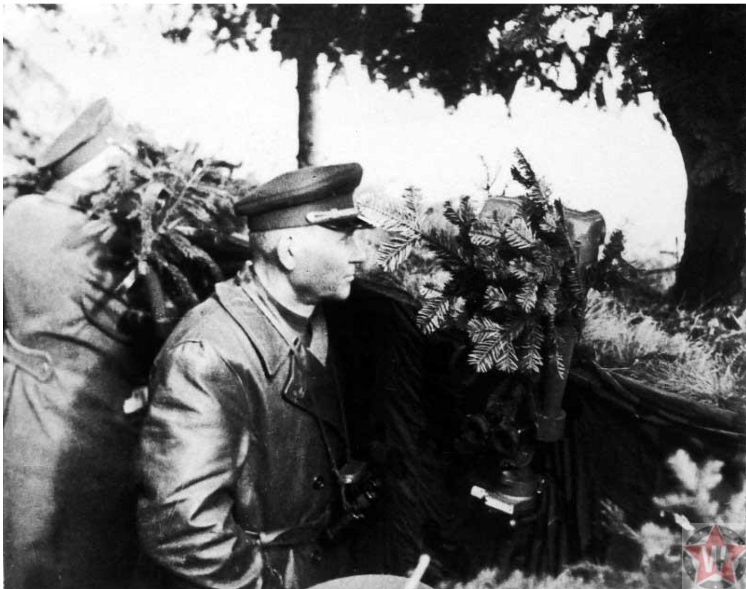
Командующий 1-м Украинским фронтом маршал Советского Союза И.С. Конев следит за ходом боя

километров. На следующий день, бросив в бой главные силы фронта, они прорвали вторую полосу и продвинулись на 20 километров. Противник отошел за реку Шпрее. Вермахт, препятствуя глубокому обходу всей берлинской группировки, перебросил на этот участок резервы группы «Центр». Несмотря на это, наши войска 18 апреля форсировали реку Шпрее и взломали передний край обороны третьей полосы. По окончании третьих суток в направлении главного удара 1-й Украинский фронт продвинулся на глубину до 30 километров. В процессе дальнейшего движения ко второй половине апреля наши части и соединения отрезали группу армий «Висла» от «Центра». Крупные вражеские силы попали в полуокружение.