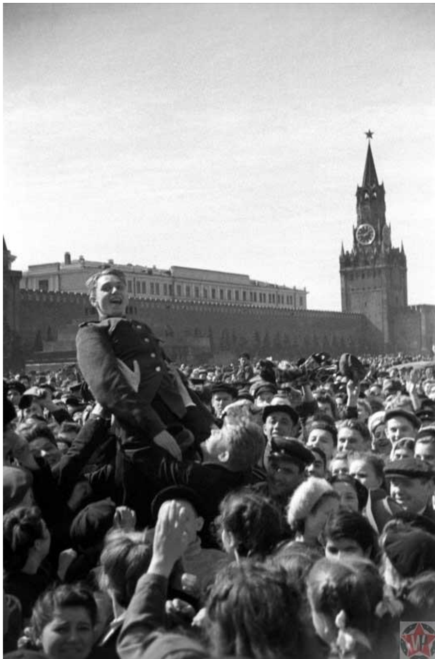
9 мая 1945 года в Москве на Красной площади

В ночь на 9 мая генерал-фельдмаршал Кейтель в Потсдаме подписал акт, означавший полную и безоговорочную капитуляцию Германии. Так 9 мая стал Днем Великой Победы. Там же вскоре прошла конференция, на которой была решена судьба послевоенной Германии и окончательно перекроена карта Европы. До финала Второй мировой войны 1939-1945 года оставалось еще несколько месяцев.