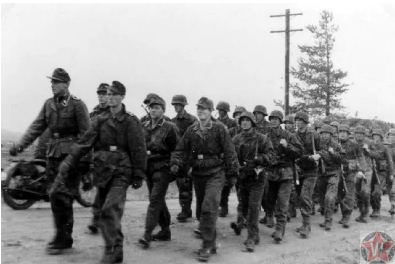
Дивизия вермахта перед сражением за Берлин

Существует также мнение, что у Гитлера была надежда на так называемое оружие возмездия, которое находилось на стадии окончательной разработки и должно было перевернуть соотношение сил. Именно поэтому вермахту требовалось время, и потери здесь не играли никакой роли. Поэтому на советско-германском фронте Гитлер сосредоточил 214 дивизий, а на американско-английском только 60.