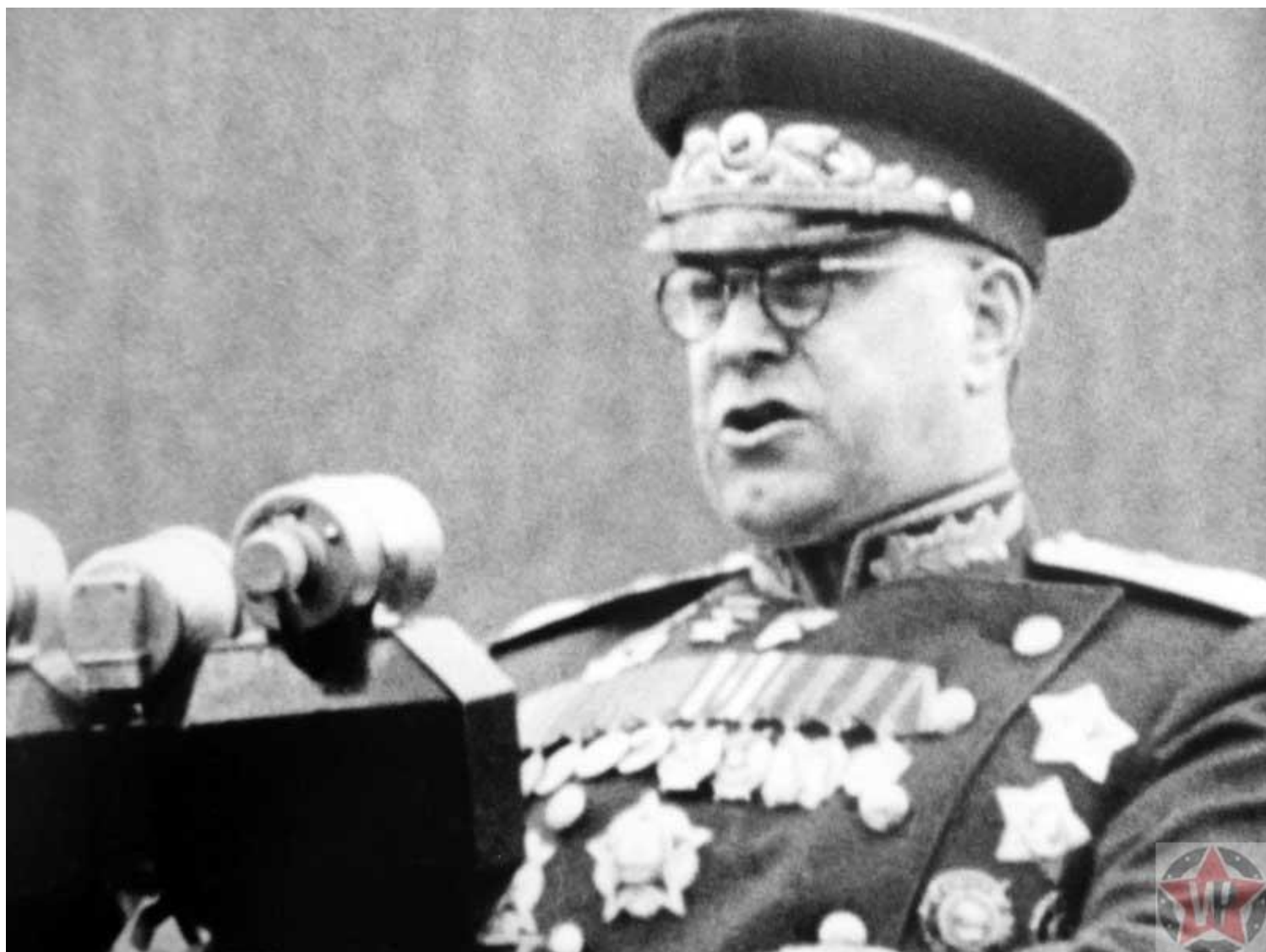
Маршал Советского Союза Г.К. Жуков выступает с речью на Параде Победы в Москве

Маршал Г. К. Жуков, который принимал тот знаменитый парад, посмотрел на репетицию проноса знамени и пришел к выводу, что для героев битвы за Берлин это будет слишком сложно. Поэтому он распорядился вынос Знамени отменить и провести парад без этой символической части.