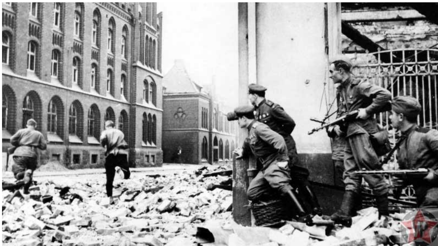
Советские солдаты перебегают улицу во время боев в Берлине

Украинского и 1-го Белорусского фронтов около 120 тысяч солдат и офицеров, большое количество танков и полевых орудий.