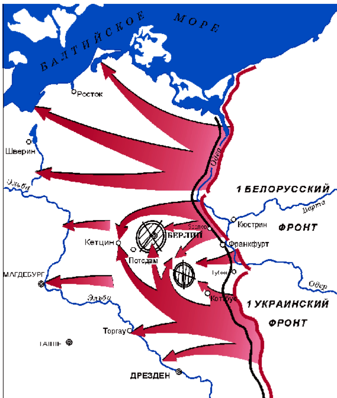
План «Битвы за Берлин»

Замысел командования был таков – согласованными ударами трех фронтов прорвать Одерско-нейсенский рубеж, затем, развивая наступление, выйти к Берлину, окружить группировку противника, рассечь её на несколько частей и уничтожить. В дальнейшем, не позднее 15 суток с начала операции, достичь Эльбы для соединения с войсками союзников. Для этого Ставка решила привлечь 1-й и 2-й Белорусский и 1-го Украинский фронты.