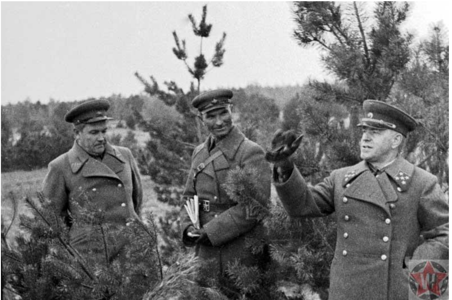
Георгий Константинович Жуков с командирами на передовой

В первый и второй день операции бои велись в первой полосе обороны немецких фашистов. Только 17 апреля удалось наконец пробить брешь во второй полосе. Немецкое командование попыталось остановить наступление, введя в бой доступные резервы, но не преуспели в этом. Сражения продолжались 18 и 19 апреля. Темпы продвижения оставались очень низкими. Фашисты не собирались сдаваться, их оборона была наполнена большим количеством противотанковых средств. Плотный артиллерийский огонь, скованность маневра из-за сложной местности – все это влияло на действия наших войск. Тем не менее 19 апреля под конец дня они прорвали третью, последнюю полосу обороны этого рубежа. В итоге за первые четверо суток войска 1-го Белорусского фронта продвинулись на 30 километров.