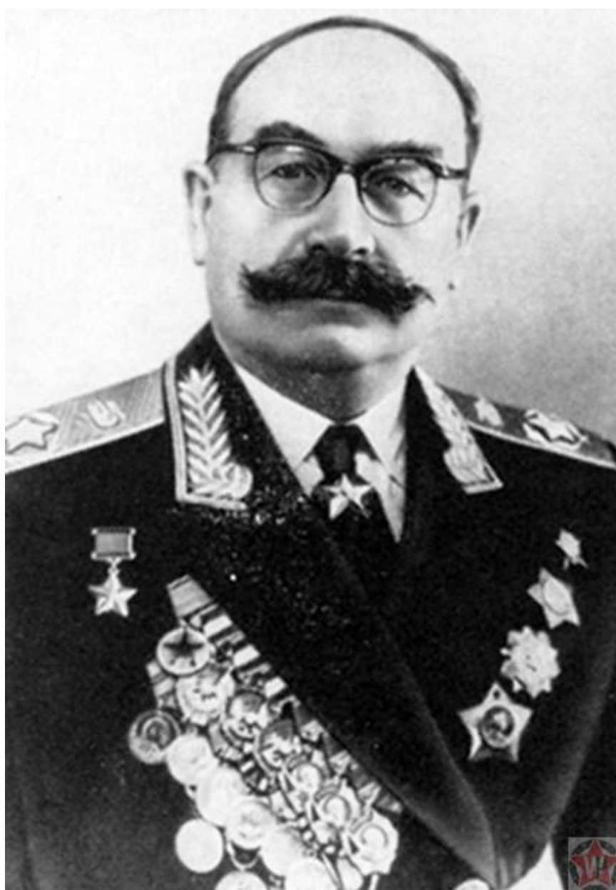
Ротмистров Павел Алексеевич

дивизий, 4 батальона тяжелых «Тигров», тогда как ГА «Центр» имела 1 дивизию танков и батальон «Тигров». Кроме того, Гитлер предполагал, что советские войска будут продолжать движение на юг: в Румынию, на Балканы, — в зону традиционных интересов России и СССР. Советское командование не спешило снимать с Украинского фронта 4 танковые армии: в болотах Белоруссии они были бы лишними. Из Западной Украины была передислоцирована лишь 5 ТА Ротмистрова, но немцы этого не заметили или не придали значения.