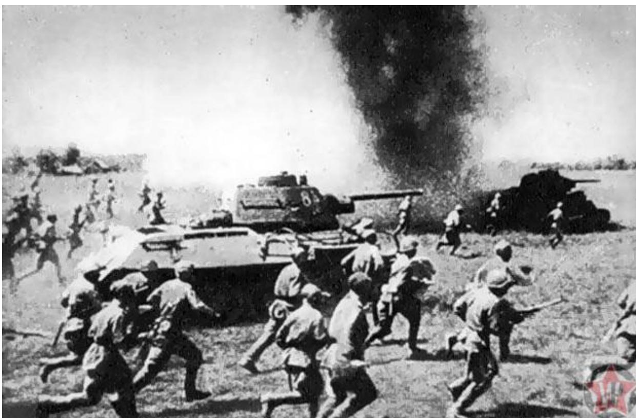
Атака в ходе операции «Багратион»

Статистическое исследование немецких потерь вооруженных сил основано на десятидневных отчетах с места военных действий. Они дают такую картину: