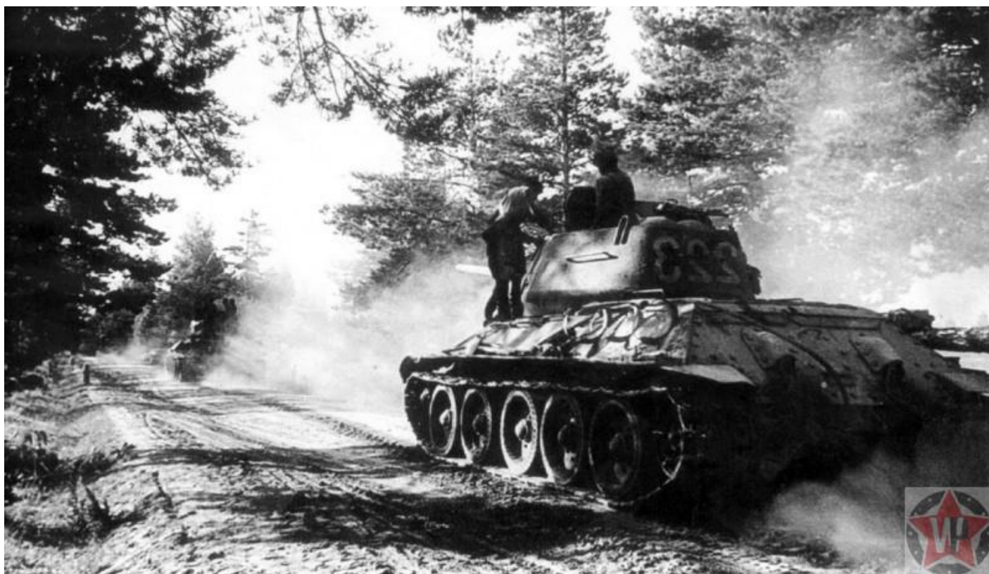
Колонна танков Т-34-85 195-го движется по лесной дороге в ходе операции «Багратион»

3. Некоторые споры вызвал в Ставке вопрос о возможности танковых маневров в болотистой местности Беларуси. К.К. Рокоссовский упоминает об этом в своих мемуарах: несколько раз Сталин просил его выйти и подумать, стоит ли бросать танки в болота. Видя непреклонность командующего 1-м Белорусским фронтом, Верховный ГК утвердил предложение Рокоссовского о наступлении на Бобруйск с юга (эта местность на немецких картах была отмечена как непроходимые болота). За годы войны советский лидер научился ценить мнение своих военачальников, даже если оно не совпадало с его точкой зрения.