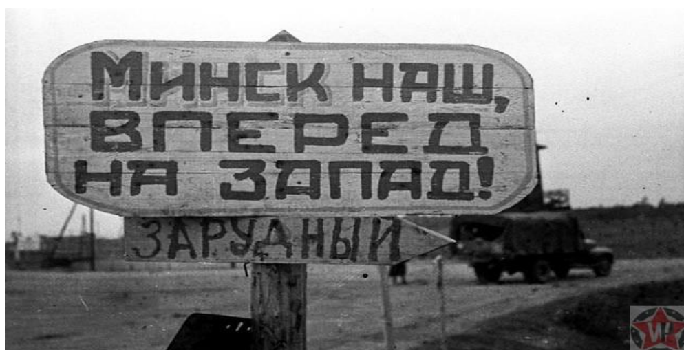
«Минск наш, вперед на запад!»

Наступательная операция под кодовым названием «Багратион» продолжалась 68 дней – с 23 июня по 29 августа 1944 г. Условно её можно разделить на несколько этапов.