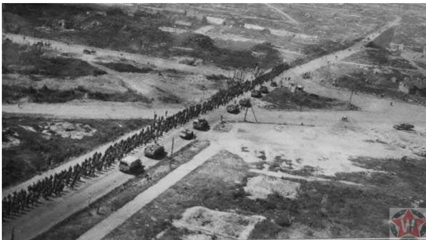
Ил-2 атакует немецкую колонну