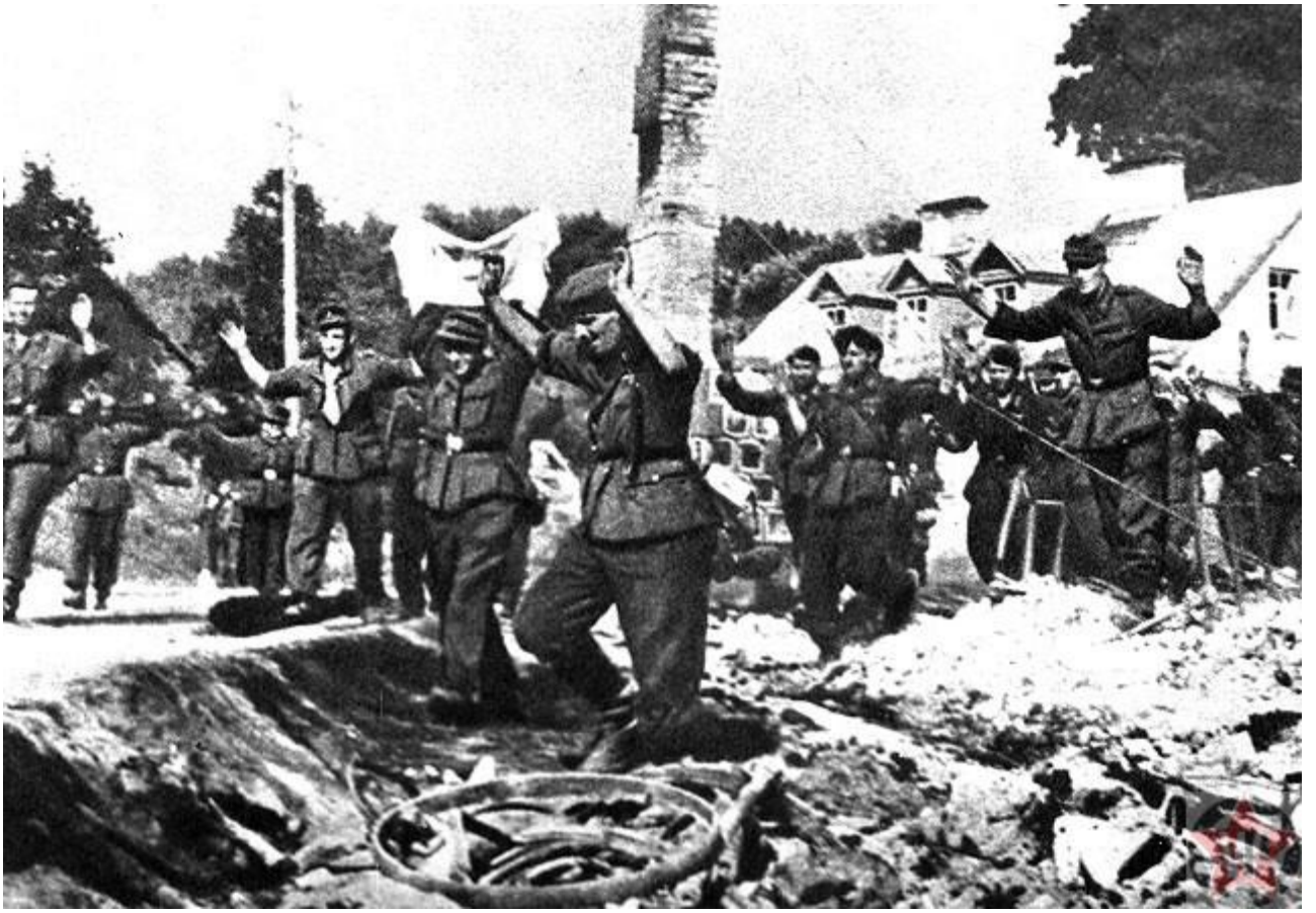
Немецкие солдаты в конце операции «Багратион»