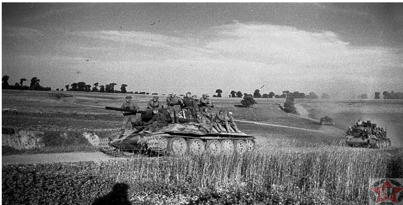
Белорусская операция «Багратион»

В 1941 г., с первых месяцев Великой Отечественной войны, мощная фашистская группировка основательно укрепилась в Белоруссии и надеялась сохранить свои позиции в 1944 году. Удары советских войск в Белоруссии оказались для немцев настолько ошеломительными, что их армии не успели отступить на новые рубежи обороны, они были окружены и уничтожены – группа армий «Центр» практически перестала существовать.