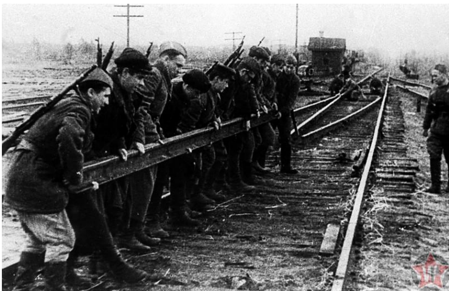
Операция «Рельсовая война»